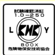
※ガソリンの貯蔵に適した容器の例