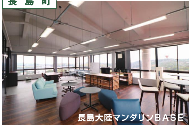
長島大陸マンダリンBASE