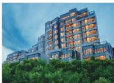
Photo is for reference only. 写真は参照用です。