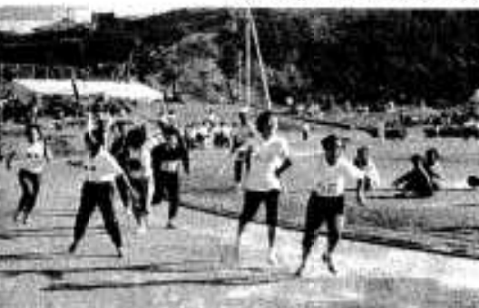
校区の期待を背負って走った校区対抗リレー