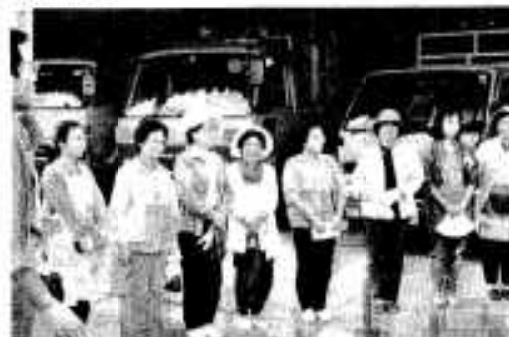
市環境保健課長から注意事項を聞いて「さあ出発」