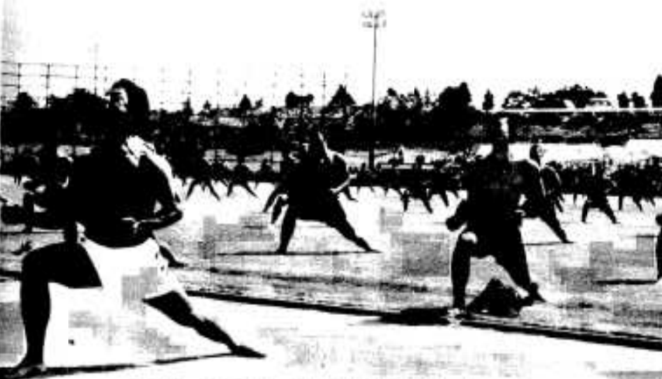
今年も大人気でした 阿久根中の「エッサッサ」