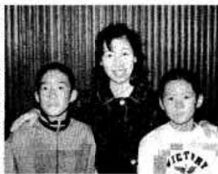
おかあさん ありがとう ④