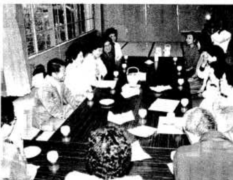
多くの反省点が出された報告会