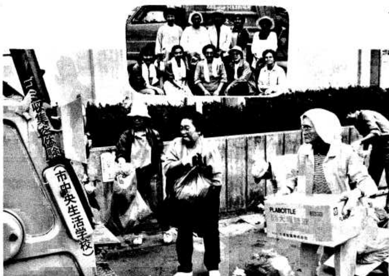
汗ビッシヨリになりながらゴミ収集（写真は参加された皆さん）