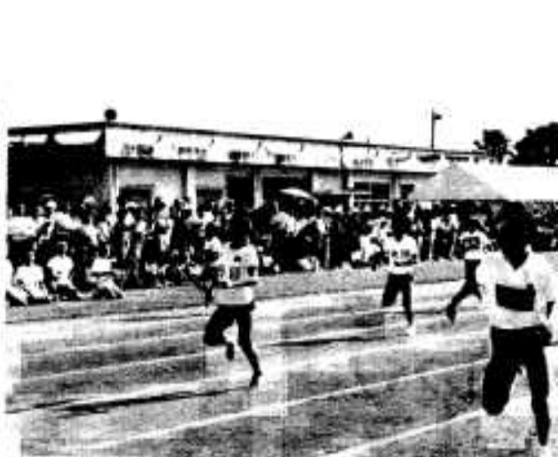
「キバレ」と声援を受けながら走る小学生