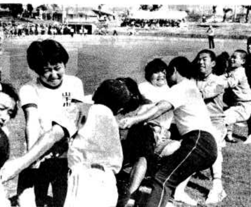
歯をくいしばってがんばった綱引き