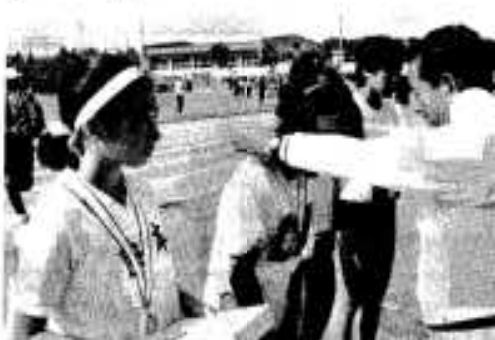
1位の選手には感激の「金メダル」