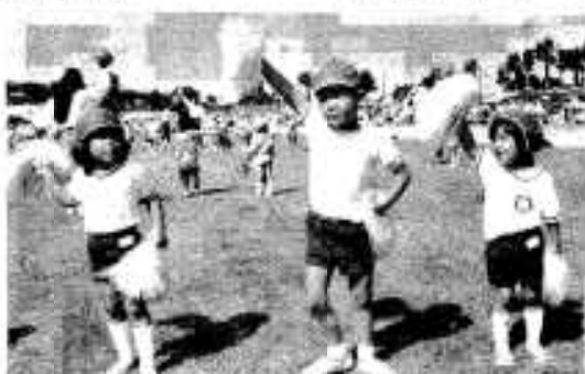
みんな上手でした園児の踊り