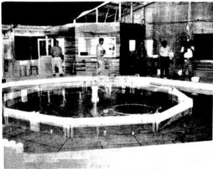
魚種量増大をめざす海洋牧場の実験室

県では、高度な水産技術を導入して漁業の振興を図る「ハイテクマリン構想」を推進していますが、その中で当市の栽培漁業センター内に漁獲量の増大を