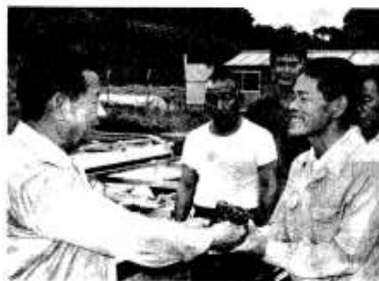
黒之浜漁業組合長に稚アワビを手渡す 新伊市長

市栽培漁業センターで試験栽培されていたアワビが順調に生育し、このほど黒之浜漁協、阿久根市漁協、西目漁協に稚貝一万二千個ずつを配分しました。アワビは昨年の十二月、母貝を瓶島から取り寄せ種苗生産を開始。約十か月で二センチほどに成長したものを三漁協がそれぞれ、の漁協管内に放流したものです。アワビの稚貝は放流後三、四年で商品として扱える十センチ以上