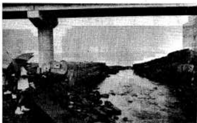
海とつながっていない不思議な「尻無川」