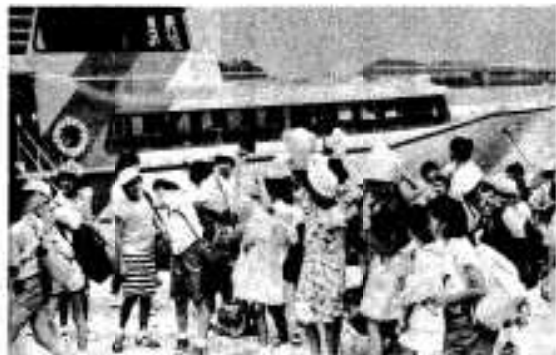
高速船で旧港に上陸した修学旅行団

般客の七十人と一緒に旧港に上陸したあと、早速、阿久根小で交流会が行われ、ふるさとで紹介やフォークダンスなどで友情を深めました。このあと、野母崎の子どもたちは鹿兒島市を訪れ、磯庭園などを見学し一泊したあと、阿久根から再び高速船で帰ってまいりました。