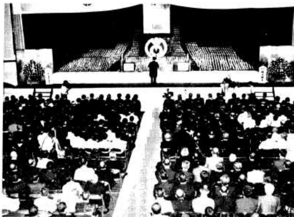
多くの方が参列して行われた市葬

た潟土地区画整理事業には市民の期待は大きいものがあります。地場産業振興にも力をいれられ、(株)西友との「商品開発相互協力に関する業務提携」を行い、また、本年四月には宝酒造との「特殊林産物開発に関する協定」を行い、当地に適した「キノコ」の研究開発による特産品化を目指して出発したばかり