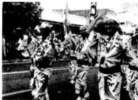
夏まつりのハンヤ節踊りを楽しむ在りし日の川州市長