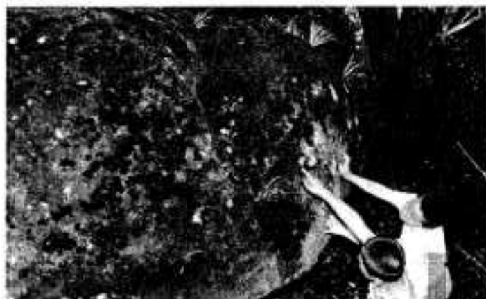
「ウワー、大きな天狗の足跡」にビックリ

国道3号大丸から波留のガ―ド下を通ると、すぐ左側にきれいに整備された公園に黒神の巨岩があります。 この黒岩が昔、ここらあたりが大きな入江となっており、海