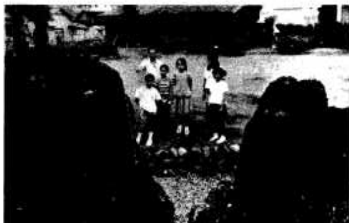
昔、ここらへんが海だったことを証明する「黒神岩」