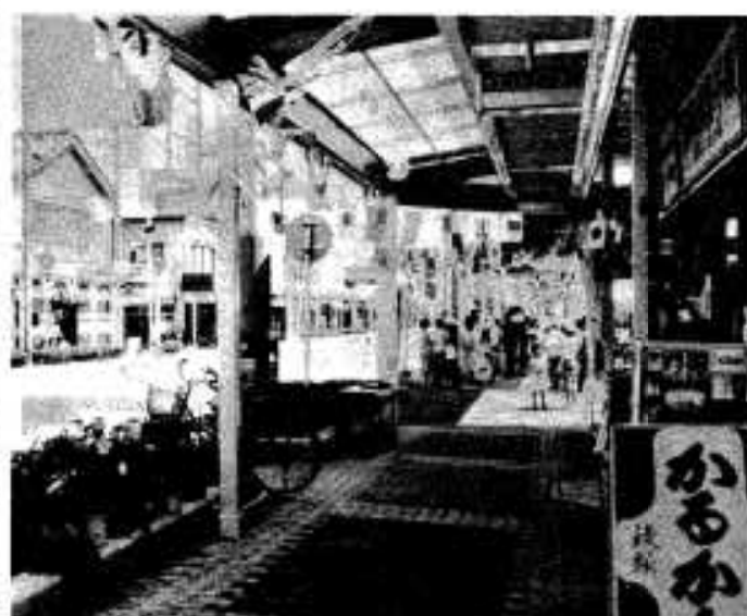
さわやかなアーケードが完成した「ふれあい通り」

今年の二月から改修工事が進められていた大丸町商店街アーケードがこのほど完成し七月九