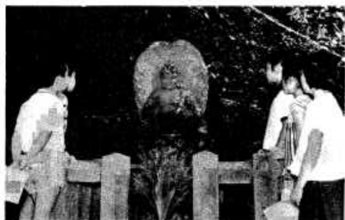
中央公園入口にある、火の神様「空順法印石像」

には米袋のようなものをしっかりと握っているのがあります。この像はいうまでもなく、昔の人々が豊作の願いをこめてつくったものであります。