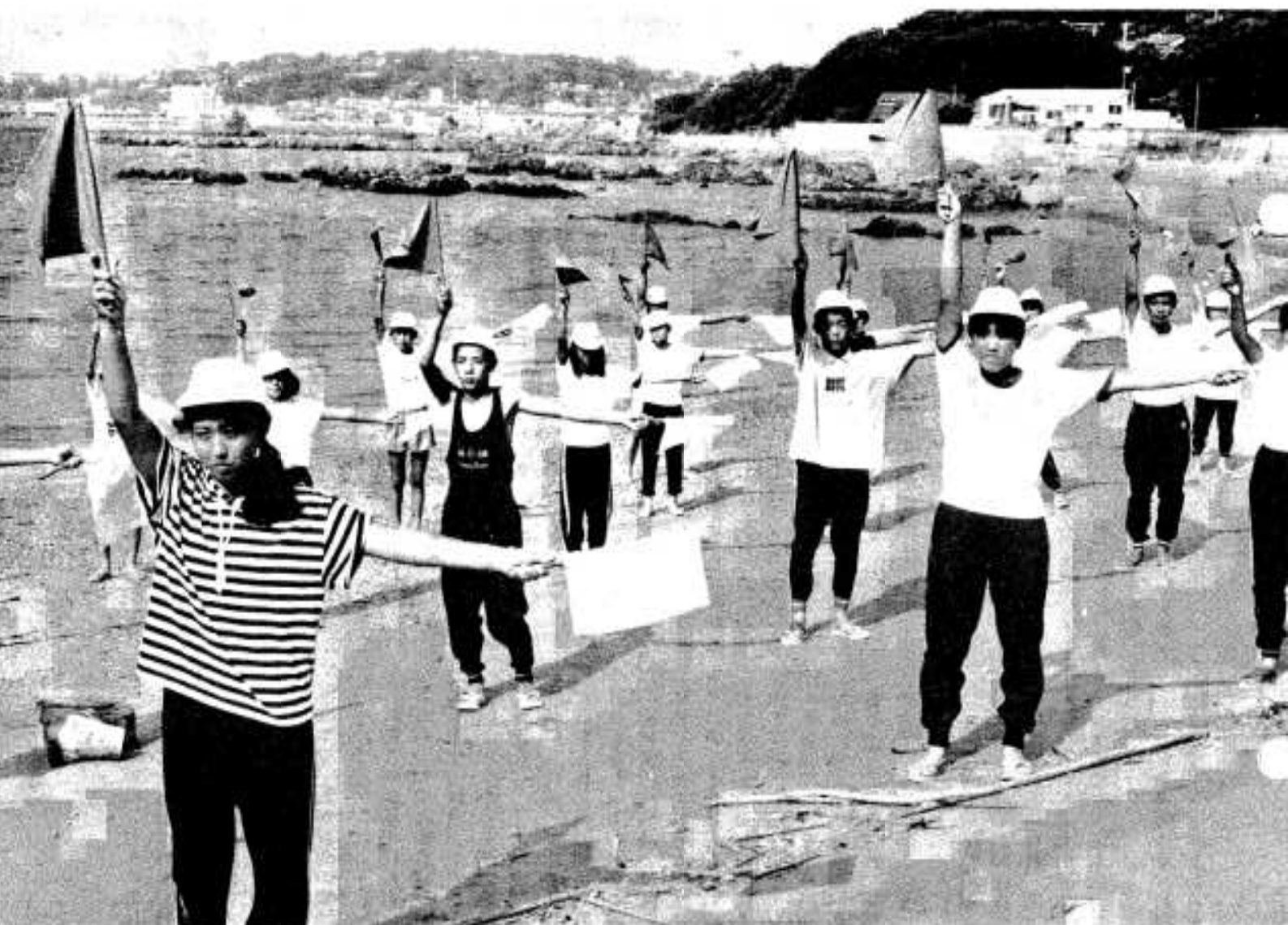
(手旗信号を受講する水産教室生)