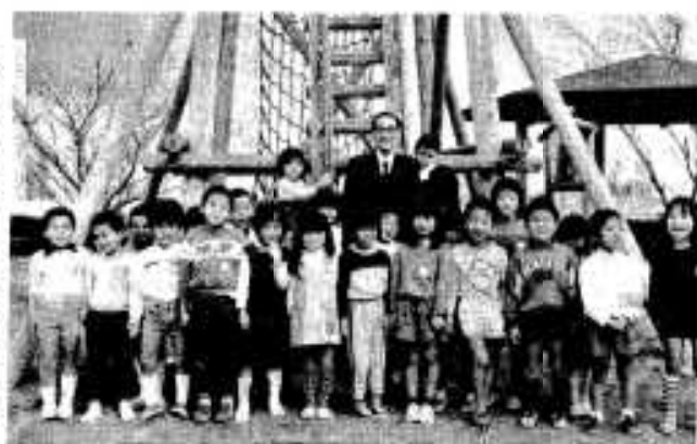
大好きな子どもたちに囲まれてニッコリ微笑む川州市長

このあと参列者全員による献花が行われ、川州市長のご冥福を祈りました。故川州市長のご冥福を祈る意