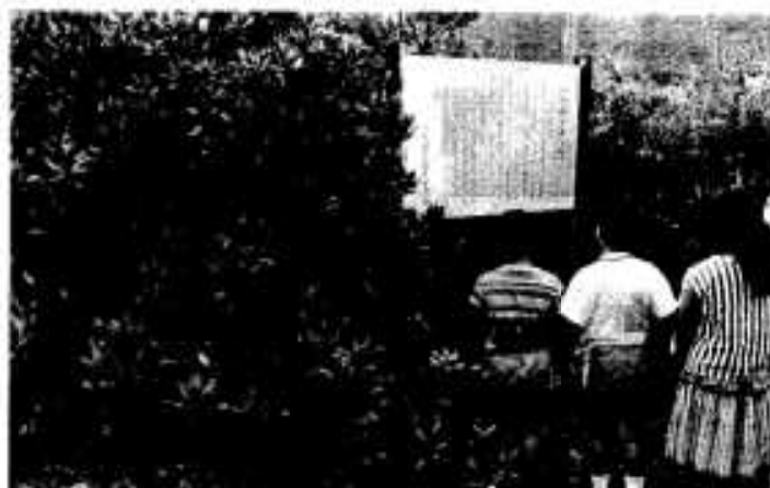
九州本土では唯一の自生地である「ハマジンチョウ」