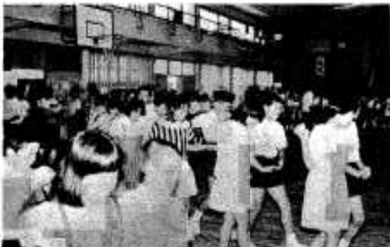
阿久根小児童と楽しくフォークダンス