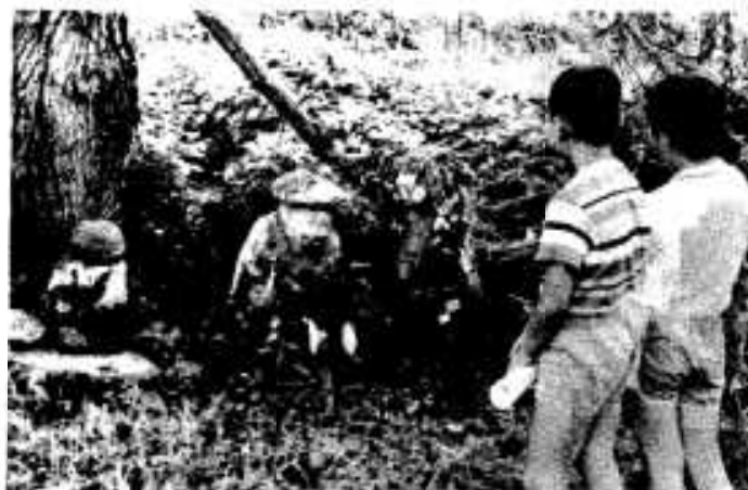
昔、豊作の願いをこめてつくられた「田の神像」