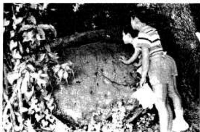
「フタをとってみたいなあ」本物ソックリの鍋石