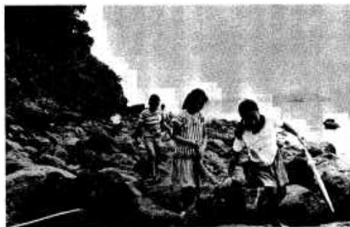
ちょっとした探検気分（佐潟岬で）

入口はせまいですが、奥は広く 遠くこしき島まで続いていると 言い伝えられています。 また、洞窟の中には多くのコ ウモリが生息しております。