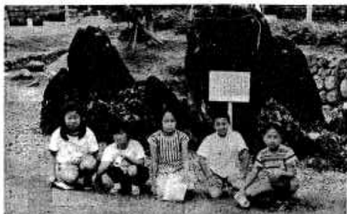
黒神岩の前で記念写真「ちょっと疲れたかな」