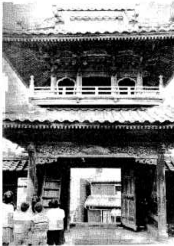
九州には2か所しかない西徳寺の楼門

阿久根の歴史やふるさと阿久根のすばらしさが一段とわかっ ていただけるのではないのでしょうか。