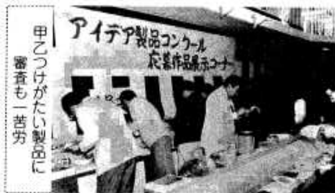
甲乙つけがたい製品に審査も一苦労

アイデア製品コンクールは市産業祭会場で十九日行われ七十点という大変多くの応募がありました。製品のほとんどは市内の産物を材料としたものでしたが、アイデアと工夫をこらした珍しいものばかりで、審査にあたった新製品開発推進会議の皆さんも苦労され