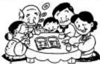
交通事故をなくすために、家族みんなで話し合ひましょう。