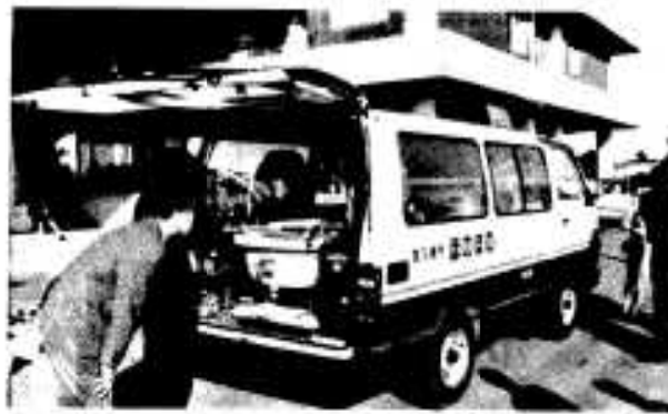
贈呈された入浴専用車「ほのぼの号」