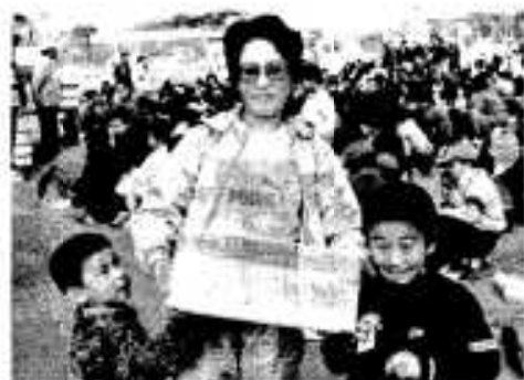
抽選会でキピナゴを1箱もらって 「やったね母ちゃん」