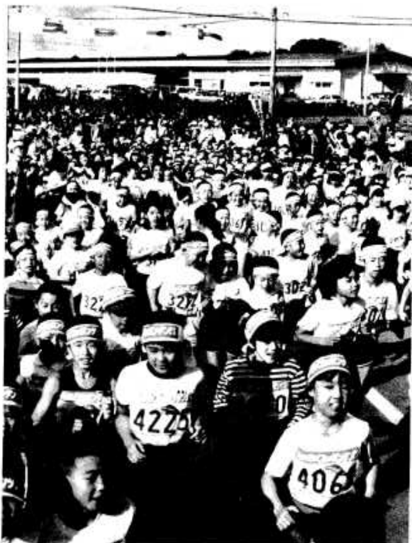
小学生3キロのスタート「さあ、マイペースで楽しく走るぞ」

ス日和。三時、四時、五時と次々 にスタートした参加者は、沿道に つめかけた多くの人の声援を浴び ながら心地よい汗をかきました。 また、ゴールした参加者は市婦 人会や関係者らによるふかし芋、 イワシの塩焼、ウドンなどに舌鼓 をうちながら心のこもった接待に 感激。最後のお楽しみ抽選会では、 水揚げされたばかりのキビナゴな どのビッグな賞品が並べられ、番 号が読みあげられるたびに大歓声 がおこるなどして、和やかなうち に終了しました。