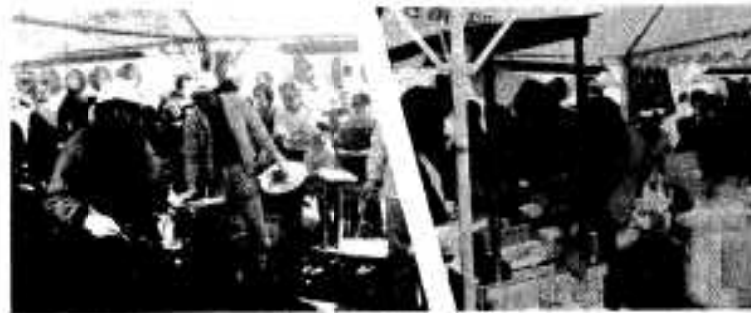
長〜い列ができて、もっとも人気が集まったイワシコーナーとウドンコーナー