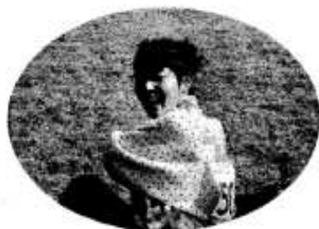
イヤーン、疲れてんだから写さないで