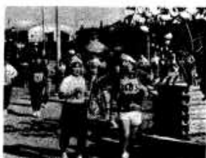
「オイ、もちっとじゃキバレ」