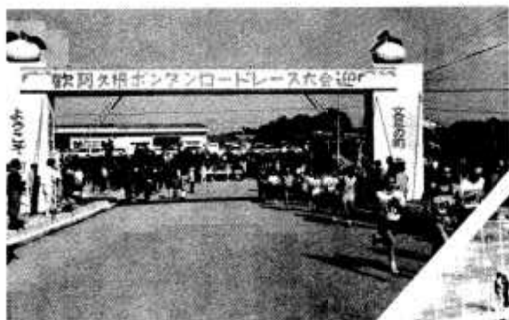
特大のゲートをくぐり、ゴールまでもう少し