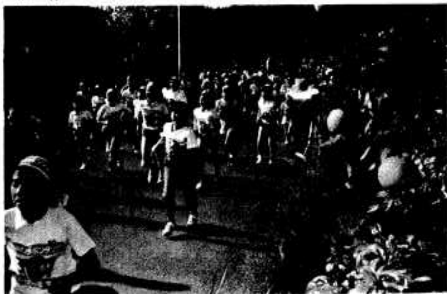
ポンタンも応援しています ♪ガンバレ。