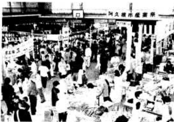
体育館いっぱい展示販売され、にぎわった産業祭

アイデア製品コンクールは市産業祭会場で十九日行われ七十点という大変多くの応募がありました。製品のほとんどは市内の産物を材料としたものでしたが、アイデアと工夫をこらした珍しいものばかりで、審査にあたった新製品開発推進会議の皆さんも苦労され