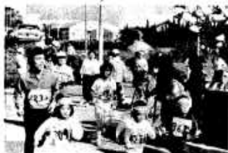
子どもたちに負けてたまるか。しかし……