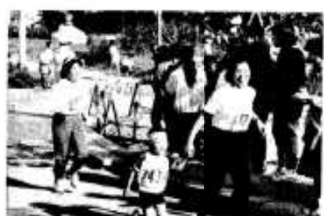
お母さんと手をつないで走ったよ