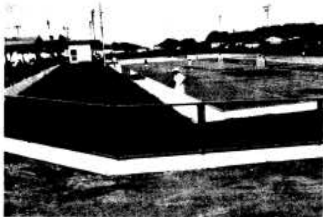
◀▶ 待望の野球場と 庭球場が完成し、市民も大喜び (7月)