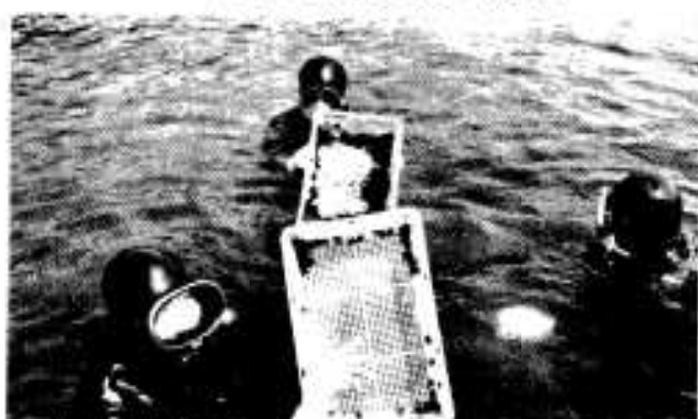
▲栽培漁業センターではアカウニ（5月）とガザミ（7月）を放流。試験栽培が着々と進む