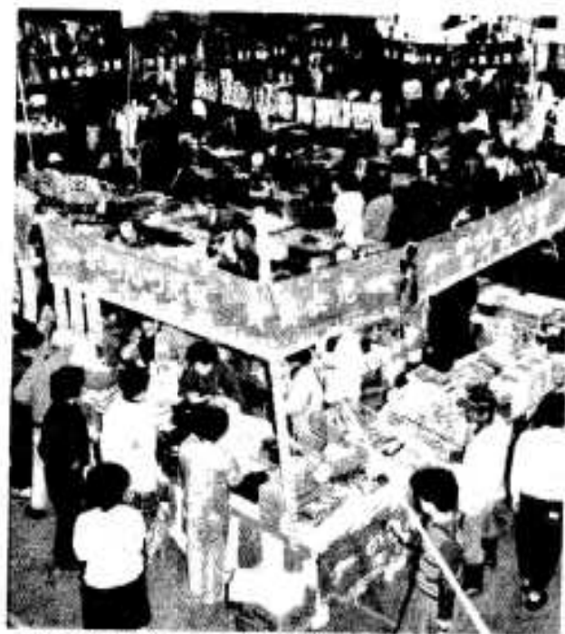
市内の産物が一堂に並べられ、安く販売されます。