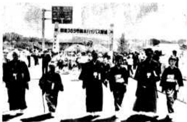
▲脇本バイパスが全面開通され、 産業、経済、観光の発展に大きな期待 (10月)