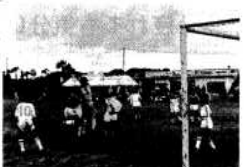
多くの父兄の応援を受けて、激しくボールをとりあうちびっ子たち(総合グラウンド)

折口東が優勝 阿久根ロータリー旗争奪老人ゲートボール大会 十二月一日 (長島・東町を含め64チーム参加) 優勝 折口東 二位 淵 三位 あけぼの(脇馬場) 永田下