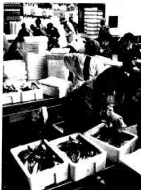
▶「全国に届け」とイワシふるさと便を実施（1月～3月）