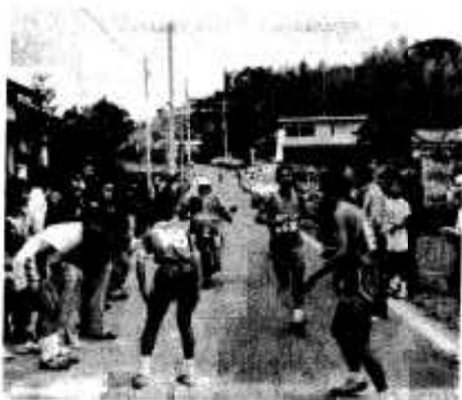
タスキをとり「たのむぞ」と、次走者へ(4区・5区の中継点)