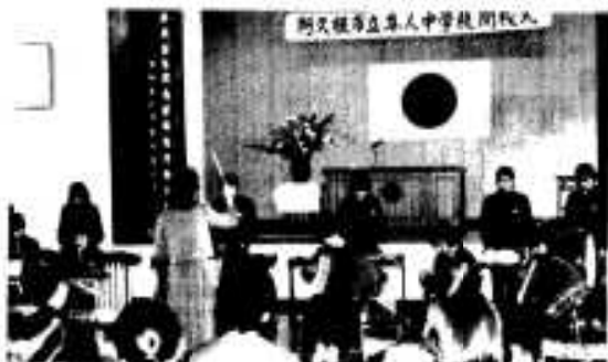
▶年人中学校が三笠中学校に統合（4月）