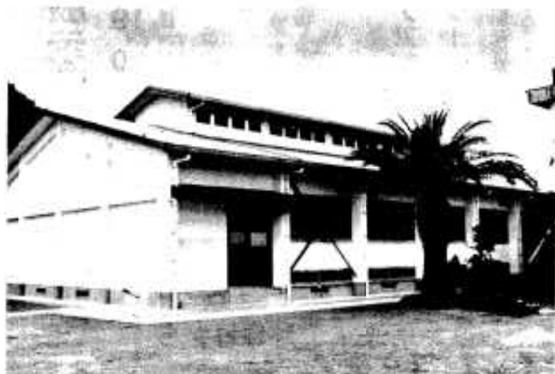
▲三笠中学校柔剣道場完成 総建設費約3,100万円かけて、面積350平方メートルの立派な 道場が完成し、12月5日、盛大に落成式が行われました。