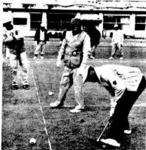
元気に老後を迎えたいものです 「写真は12月2日に行われたロータリー旗ゲートボール大会で寒さも何のそのと元気いっぱいのお年寄り」