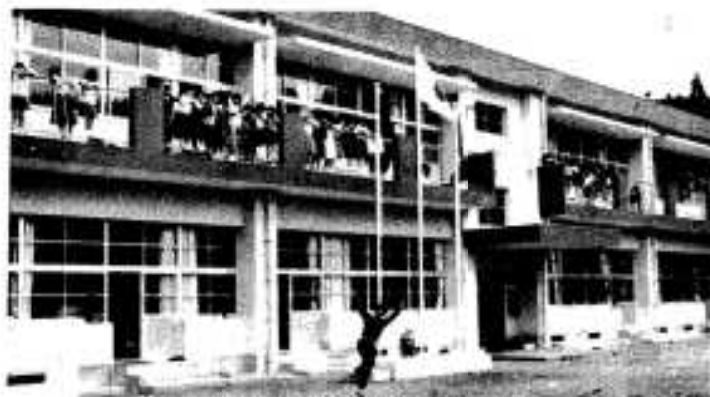
▲鶴川内小学校の新校舎が完成し、大喜びの子どもら（3月）