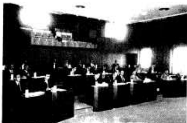
▲24人の市議会議員が決まり、市政発展のためにスタート（5月）