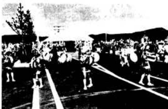
脇本小学校の児童らが「山田歌」を披露し開通を祝う