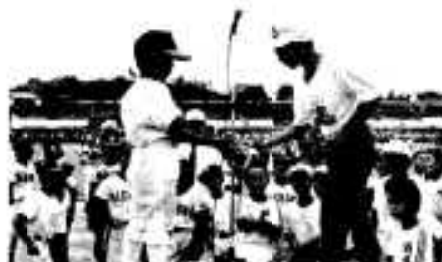
ジャンケン大会決勝戦、軍配はどちらに