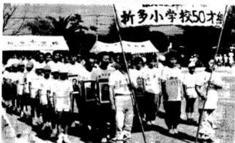
懐かしい小学生時代を思い出す 折多小学校50歳組の皆さん