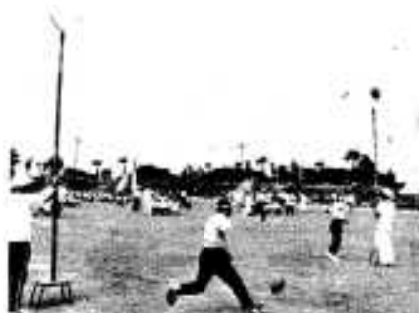
「オイ、ボールよとまれ」早くつかめないと