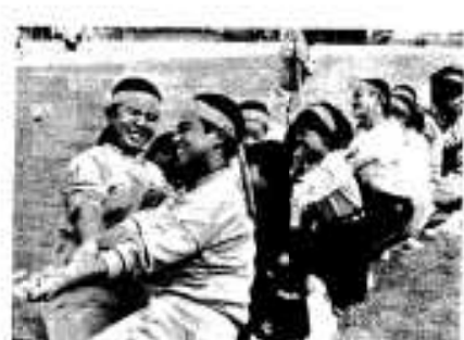
一本の腕に全身の力をこめて「しかし、相手も強かぬー」