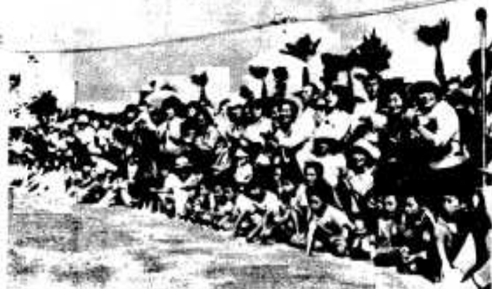
「キバレー」と多くの応援でにぎわう