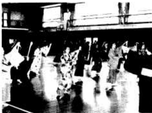
「健康が一番です」元気に通りの練習をするおばあちゃん