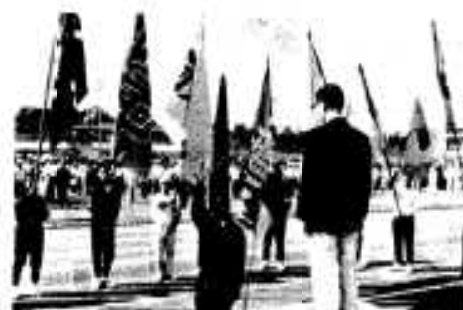
「がんばります」と力強く宣誓

恒例の第十一回市民運動会が十月十日の体育の日、総合グラウンドで開催されました。 当日は絶好のスポーツ日和で、各校区代表の選手をはじめ応援者など、多くの市民が参加。ピンコロがしや年代別リレーなどの採点種目や、また、阿久根中学校生徒による「エッサツサ」と呼ばれる集団演技が披露されるなど、例年にも増して一段と盛り上がりを見せていました。