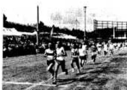
声援を受けて力走する選手(1500メートル競争)