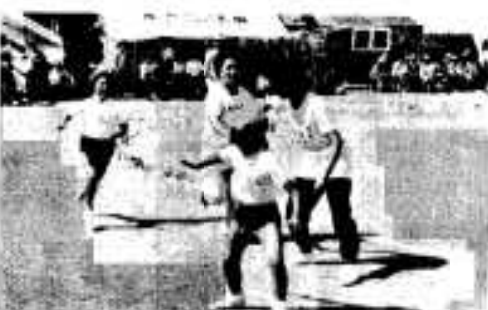
「まだ子どもには負けんど」とリレー競争

全国各地から母校の小学校運動会に集まり、今や花形種目として大変な人気を呼んでいる五十歳組と小学生とのリレー競走が今年も十月四日、市内のほとんどの小学校で行われました。 折多小学校では約五十人が参加。同級生の遺影を胸に、ユニホーム姿で入場し場内を一周。このあと子どもたちとのリレー競走を行い、小学生時代を思いだしながら力走し、見物人から盛んな拍手を浴びていました。