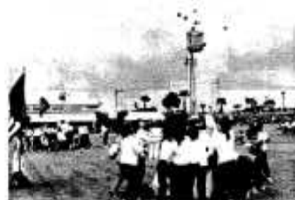
時間はあとわずか「お願い入って」