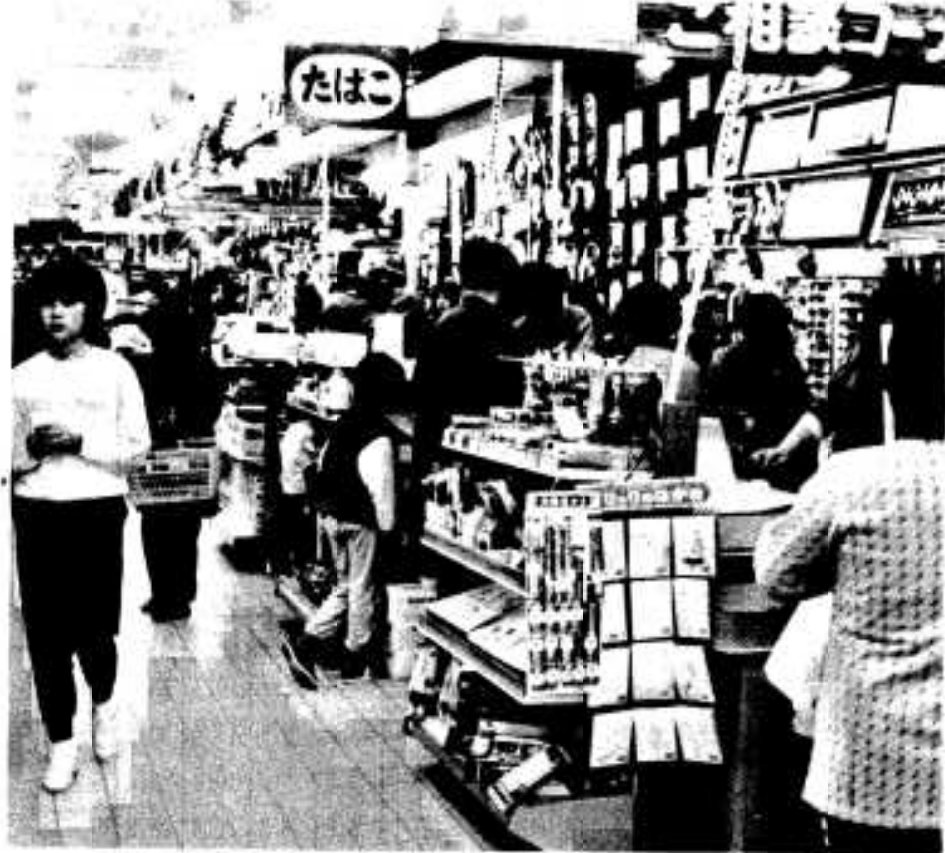
にぎわう商店もあるのですが //