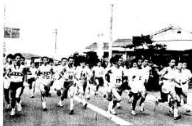
臨本山仁田を一斉にスタート

第三十四回市内一周駅伝大会は、十一月二十四日、一般の部に十九チーム、職域に六チームが参加して、臨本山仁田から大川中学校までの八区間二十五キロのコースで熱戦が展開され、総合で大川陸友会が優勝しました。