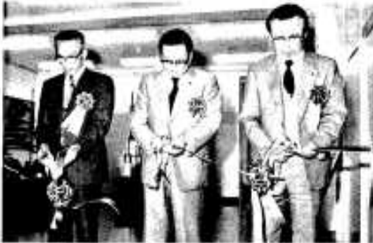
テープカットする大磯教育長(右)川畑市長(中)富古議長(左)

使用されていた万載、千載、石臼すなどや米車、ザグイ、糸くり機の養糸具。このほか、あんどん、ランプ、ちようちんなどが展示されています。