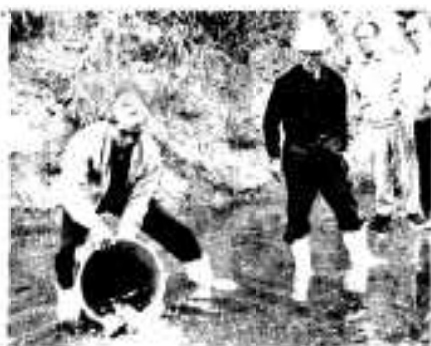
高松ダムに放流された稚ゴイ

釣りが楽しめたらと、十一月九日、市内鶴川内の高松ダムに黒ゴイの稚魚五十五キログラムが放流されました。