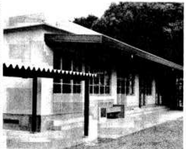
▶鶴川内中学校校舎……鉄骨造り平家、英語しし教室、準備室、生徒会室など。