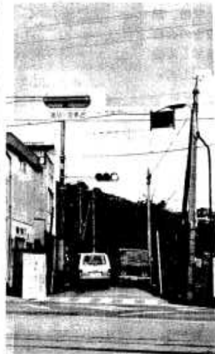
工事が始まった中源田住宅入口

この市道に入るときが一番混雑するもので、車の兼ねが思うようになり、昨年十一月二十五日に信号機が設置され、いくぶん緩和されましたが、ラッシュ時の交通渋滞は続いていました。 計画では、国道3号から国道上り約三千メートル、現在より約二メートル拡幅し平均六メートルに、側溝にもフタを