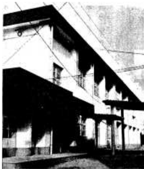
▲三笠中学校校舎……鉄筋コンクリート二階。一階木工室、音楽室など、二階しし教室、家庭科室など。