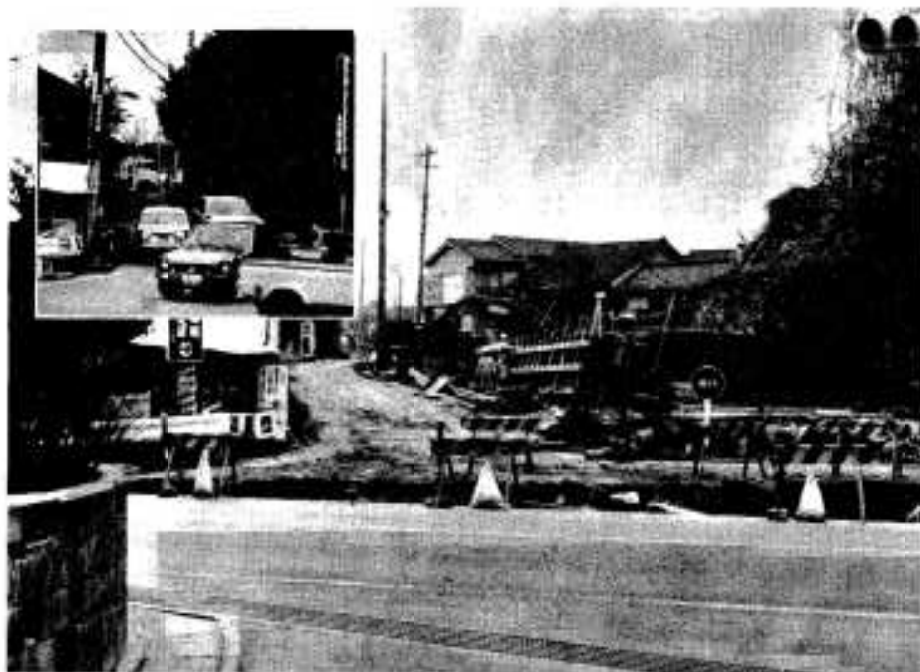
工事も始まり、難合困難だったグラウンド入口も近日中には解消されます