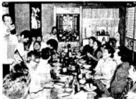
エプロン姿で頑張った男性たちと奥さん方

市内臨本相野の笹原家の氏神講が、二月二日行われ、無病息災と一族の繁栄を願ったあと、男性が