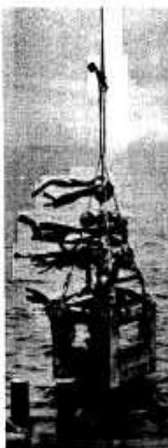
倉津沖に投入された底層式浮魚礁

ド型にし、ここにナイロンの網を張り、この網に長さ一メートル、幅十五センチのビニールの人口海草を付け、直径四十センチの浮き九個で、人口海草の付いた部分を海中に浮かせるもので、漁協が県や市の補助を受け、約百万円の事業費で五個造ったものです。