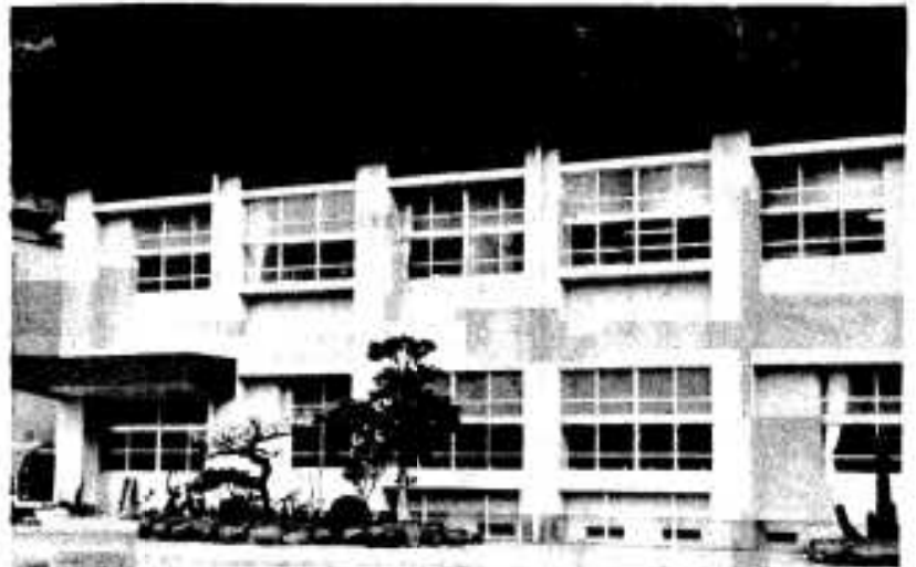
▲大川小学校校舎……一階校長室、理科室、準備室、二階音楽室、準備室など。

昨年から工事中だった、大川小学校、鶴川内中学校、三笠中学校の一部校舎の改修が終り、このほど地区民多数が参加して盛大に落成式が行われ、完成を祝いました。