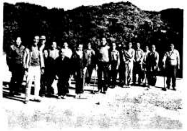
楽しくゲートボール。全員で「ハイポーズ」

市内西目の馬見塚区に、このほどミニ運動公園が完成し、区民総出で公園開きを行い、完成を祝いました。