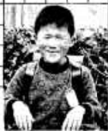
山下区 うしろざこたいしくん(6)