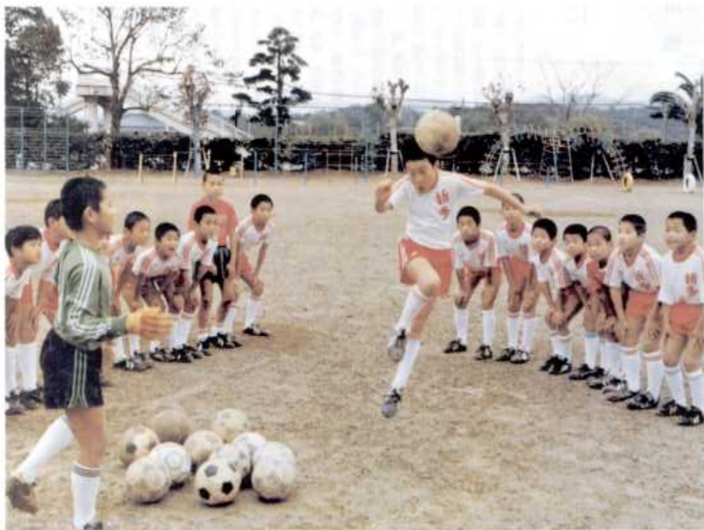
新年にダッシュする折多小サッカースポーツ少年団