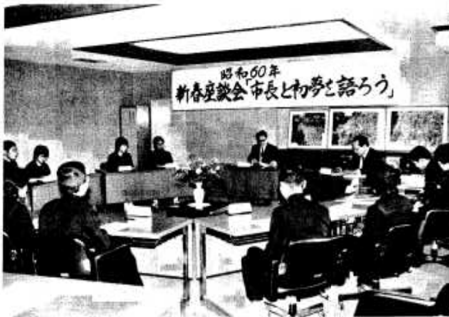
フレッシュな意見が出た。新春座談会

昭和六十年の希望の年を迎え、お目出度うございます。本年も何かにつけ厳しさが予想されますが、阿久根市にとっては、各方面にわたり一段と飛躍、発展が期待される、希望の年を迎えています。そこで、新春にあたり、阿久根の若い中学生の皆さんに集まってもらい、阿久根市の発展策、友だちどうしの顔顔、自分の将来の夢……など、フレッシュな新春座談会を企画してみました。