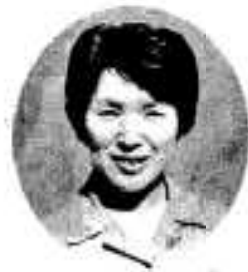
牛之浜サイコさん(40)