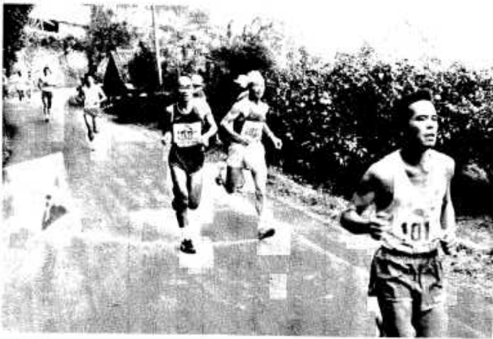
ポントンをながめながら力走する選手の皆さん