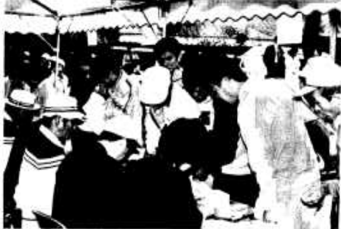
裏方さんの協力により大会は大成功