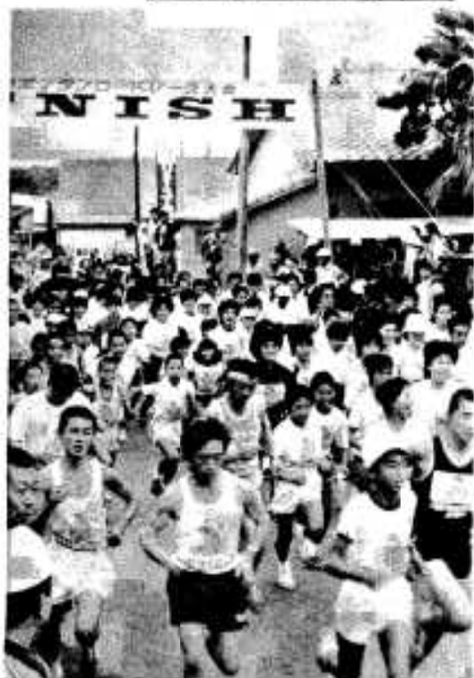
細井製作所前を一斉にスタート(3%)