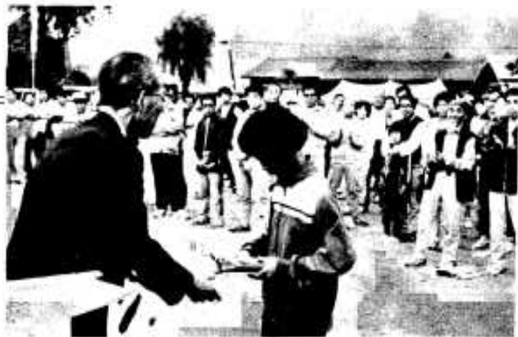
ふれ合い賞なども贈られ、参加者は大喜び