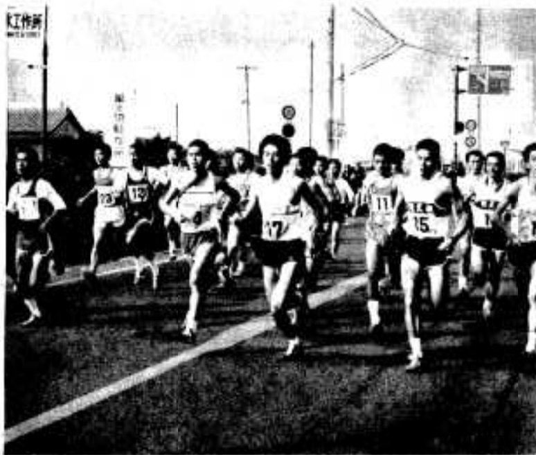
臨本山仁田を一斉にスタート

27チームで熱戦 昭和二十七年市制発足と共にスタートした市内一周駅伝大会、今年のは数えて三十三回、一般の部に十八チーム、職場に九チーム、合計二十七チームが参加し、十一月二十五日、臨本山仁田から折口、鶴川内、尾崎、弓木野、大