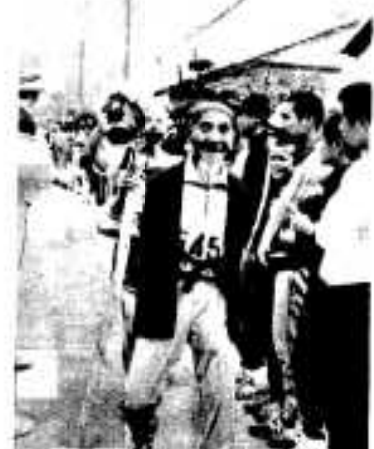
水戸黄門さんも5%に挑戦、無事ゴール