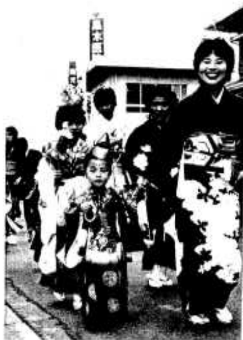
かわいい稚児行列

市内臨本西徳寺の稚児行列が十一月十八日行われ、沿道は華かなふんいきにつつまれました。お寺発足百年祭として行われ、昭和四十九年以来十年ぶりの稚児行列。