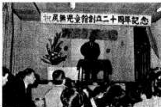
大ぜい出席して 記念式典：尻無児童館

っばい展示され、オープンと同時 に市民がどっと入場、お目当ての 品物を買いたい求めています。 また、十一日はお祭り広場も催 され、「大声大会」「牛乳早飲み 競技」それに、子どもたちによる 「山田菜」などの郷土芸能も披露 され、市民も買い物の手を休め、 楽しく観覧。市の産業祭はすっか り市民の冬の催し物として定着し たようです。