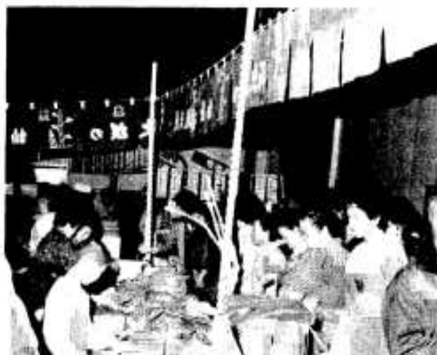
買い物客でにぎわう産業祭

「市内で生産される商品を、市 産業祭は十二月十日、十一日の二 日間で、市民会館で行われ、年末作 品よりも安くで奉仕しよう」市の