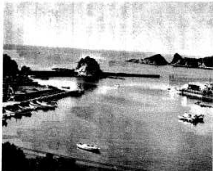
港の改修が進む 高之口港

昨年は漁協の水揚げも六二億円という膨大な額の水揚げがあったのですが、本年は大幅な減少を示しています。原因はイワシがこなかったり、大型船の誘致の問題などあったのじゃないかと思えますので、誘致の問題には市当局としてもご援助をいただきたいですね。