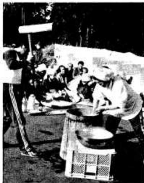
モチつきのプレゼント…… 長野スボーツククラブ

「お年寄りに、モチつきの音を聞いてもらい、良い正月を迎えてもらおう」と、同クラブが、目の不自由なお年寄りのために、と五年前から実施しているもので、今年も会員十五人が集まりました。 モチ米二十とキネ、ウヌも自前で準備。この日は朝から会員らがモチ米の蒸し方にかかり、午前