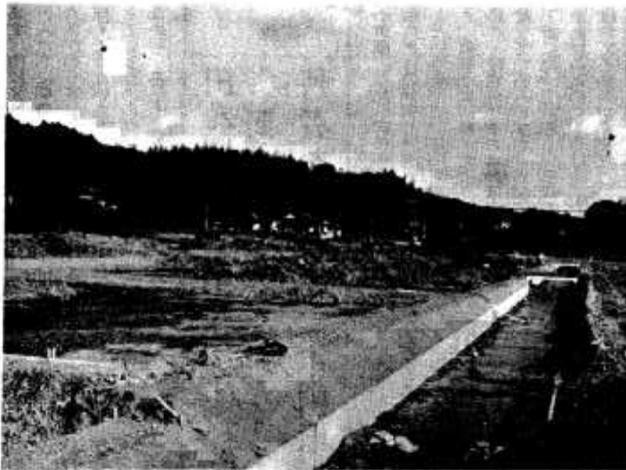
構造改善事業が進む浦地区

民の所得増加がやはり随工業の発展にもつながると思うし、そのためにも一件でも二件でも企業を誘致してもらいたいですね。