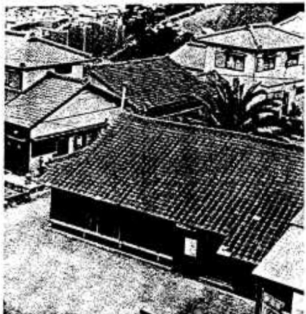
漁民研修施設が建設される倉津区(手前が現在の公民館)

議案十四件のうち主なものでは、阿久根市消防団員等公務災害補償条例の一部も改正され、死亡時に支払われる葬祭補償金、現行の「十八万五千円」を「二十万五千円」に改めたほか火災の整理など、また、消防費じゅうつ金条例を消防費じゅうつ金及び列強者特別費じゅう