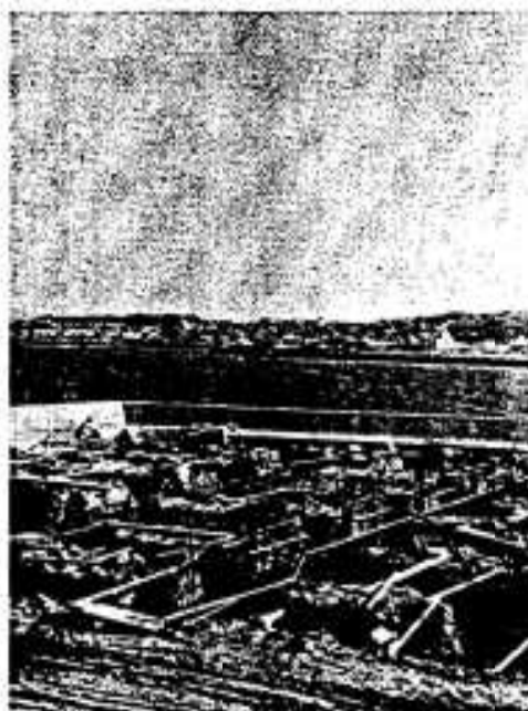
海の見える絶好の場所に青年の家が着工しました

専用の柔道と剣道の練習場がなく、教室を練習場がわりに使っていた阿久根中に、専用の立派な柔