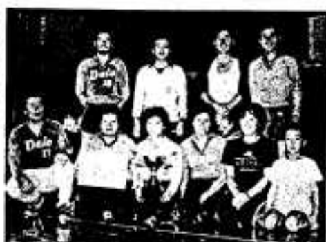
優勝した大尾チーム

り優勝しました。三位は瀬之浦下区と上原区でした。モトさんは耳が少し遠いばかり元気で、天気の良い日は庭の草取りなどされ、麦酒が好きで毎晩かかさず飲まれるとのこと、「腹八分目と薄着が長生きのコツ」とか。