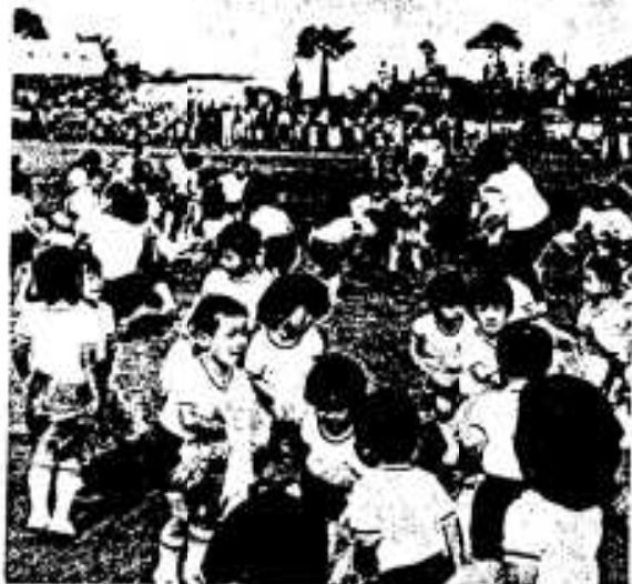
グラウンドいっぱい園児たちによる「ピンポンパン体操」