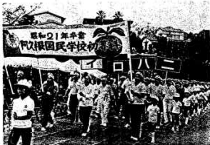
横断幕を先頭に場内を堂々と入場行進する「50歳組」 ……阿久根小学校

十月二日は、市内のほとんどの小学校で運動会が行われ、一日中にぎわいました。このうち大川、山下、尾崎、折多、西目、阿久根、