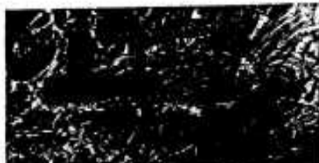
2年 きりはら けんじ