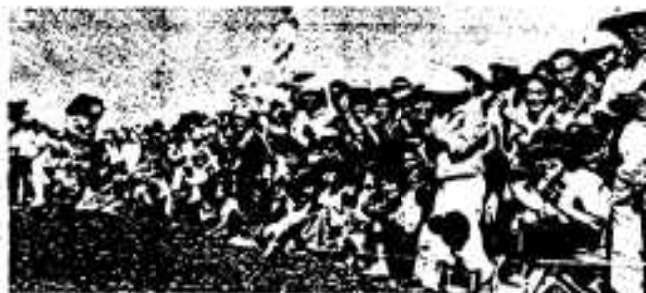
「ソレ、走れ」市民も大ぜいつめかけ大声援

秋晴れに恵まれた十月九日、市の総合グラウンドでは、七回目の市民運動会が行われ、一日にぎわいました。