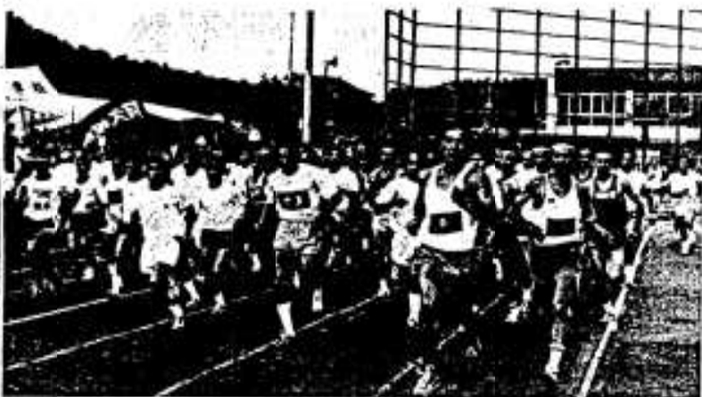
一五〇〇米走のスタート