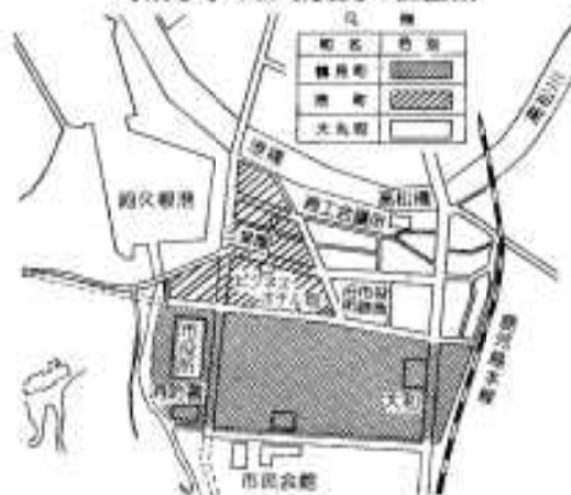
町及び字の区域変更の位置図

今後、郵便や各種の届け出など、住所を表わすときはすべてこの新しい住所を使用することになります。