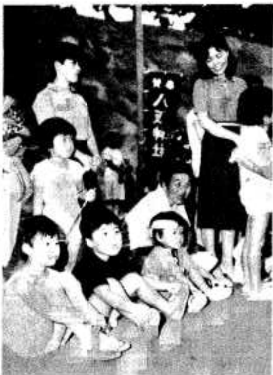
沿道には多くの市民が出て踊りを見物