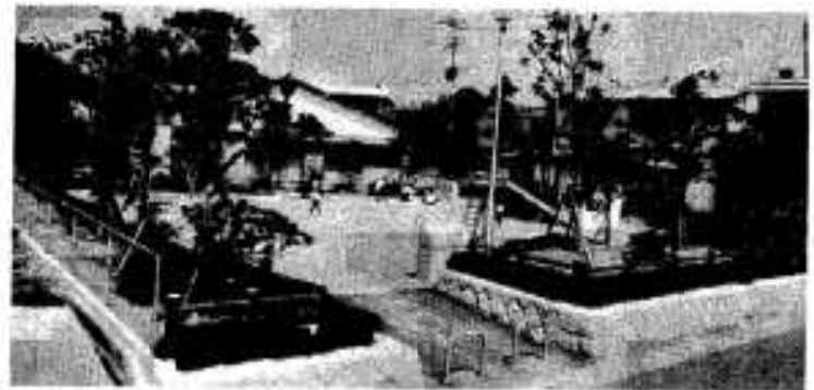
緑いっぱいわかば公園