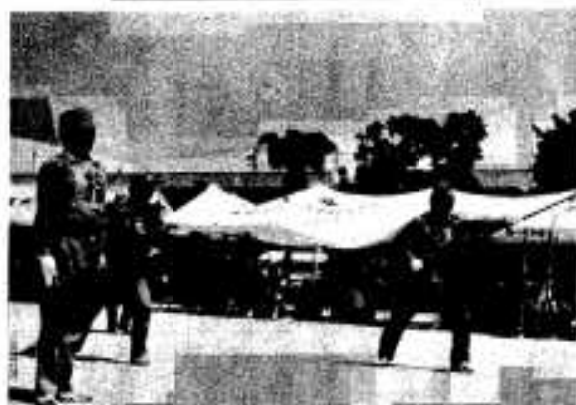
炎天下 頑張る消防団員

炎天下、昭和五十八年度市の消防ポンプ操法大会が七月二十四日、市民会館前広場で行われ、市内消防分団からポンプ車の部五ヶ、小型ポンプ車の部に二十ヶ、団員三百二十九人が参加しました。 今回の競技から操法の方法が少し変わり、競技する団員にとまどいも見えましたが、各分団が日ごろ鍛えた技を競いました。 成績は次のとおりです。 ▽ポンプ車の部 優勝大川 二位中央第一 ▽小型ポンプ車の部 優勝大川 二位多田 三位佐潟 四位尾崎 五位山下