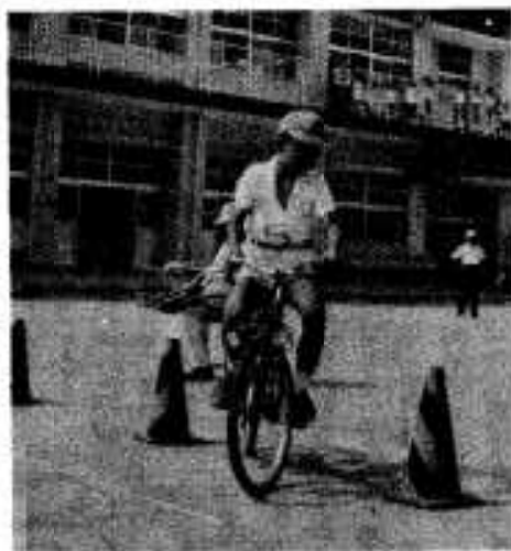
障害物の通過も上手です

折多小学校で七月十三日自転車の実技試験が行われ、三年から六年までの百四人が受験。校庭につくられた交差点や障害物を一人一人