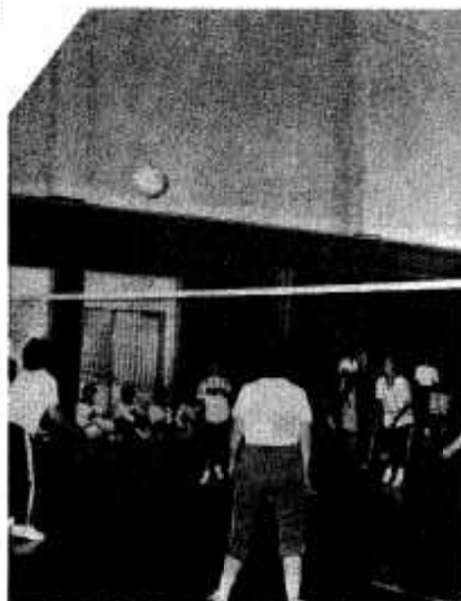
熱戦を展開したミニバレーボール

決勝戦は新町Aと設Aが対戦、新町Aが25対8で段を破り優勝、十時間におよぶ熱戦が終りまし