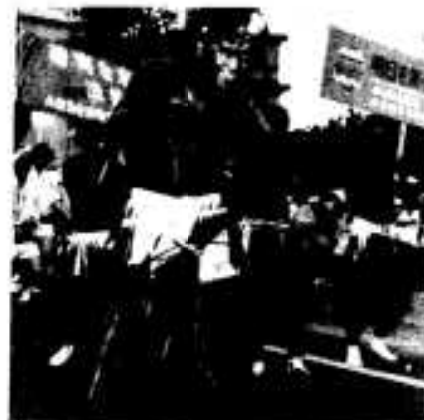
仮装大賞は？阿久根市漁協