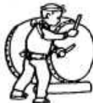
子どものバチさばきもあざやか