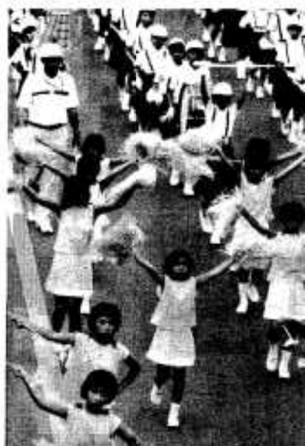
ハンヤ節踊りに花を添えた鼓笛隊などのパレード