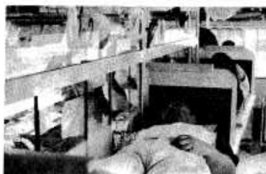
献血に協力する阿久根青年会議所会員

とは、常時アルカリ性であったり酸性体質でないこと。 ⑧充分睡眠をとり、同時に便通に充分気をつけること。 以上のようなことを意識に、常時行動することが、健康保持の重要な要素であると自覚しながら毎日を通しておきます。高齢といえども、自分の趣味と行動力によって、目下二反五畝歩を自作し営々と暮らせることに、私は生き甲斐を感じ老衰をよるこんでいるところです。