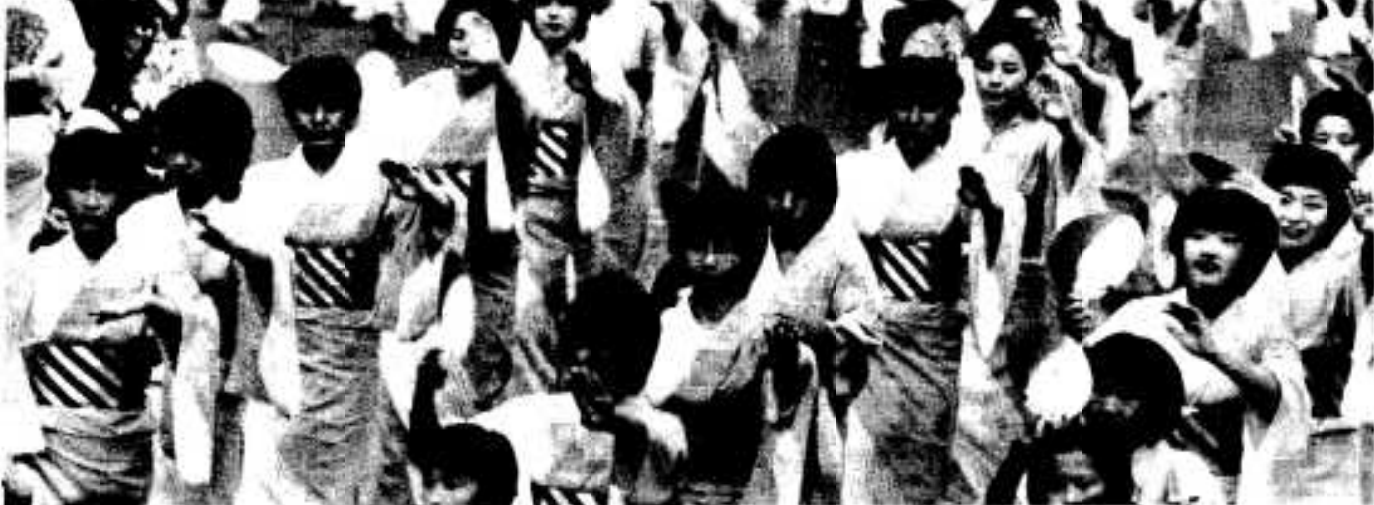
国道いっぱい「ハンヤ節」の大競演