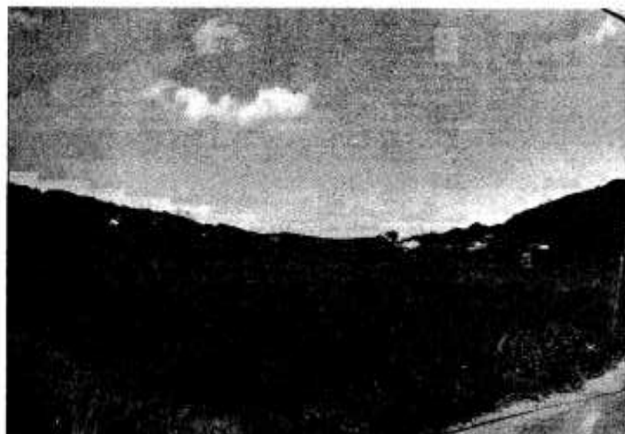
構造改善事業が始まる浦地区