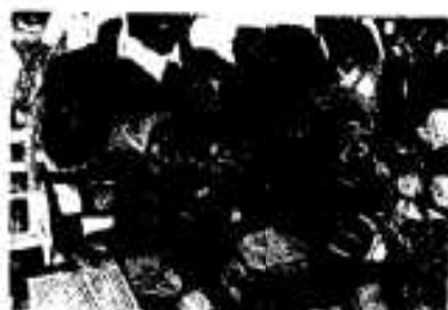
5年 上平 崇仁