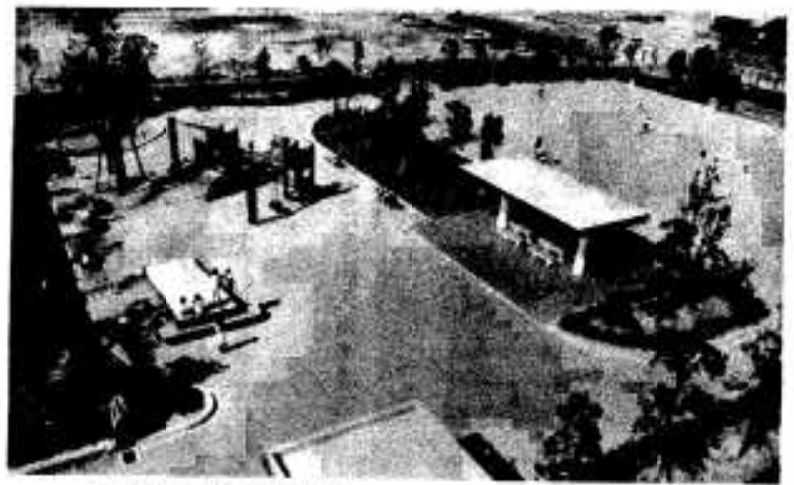
広々とした鶴見公園