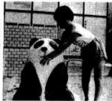
わかば公園には パンダの水飲場も