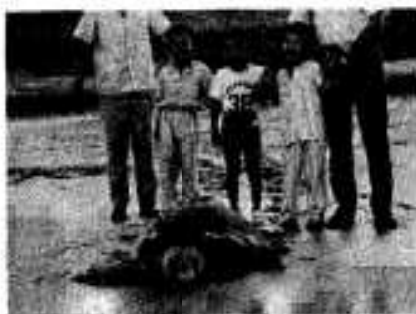
五年ぶり姿を見せた海ガメ

海ガメはメスで体長一メートル、重さ八十、ぐらいい。同海水浴場で海ガメが発見されたのは五年ぶりで、産卵を終えた海ガメは元気に海へ帰りました。