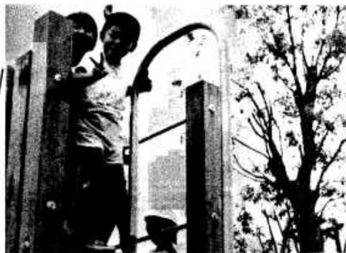
「ぼく毎日きてるよ」 ミニアスレチック

市街地のまん中に憩いの公園ができました。 一つは市役所の東側に、もう一つは大和の隣りです。 二つの公園は児童公園と幼児公園で、子どもたちが伸び伸びと遊べるような遊具も備わっています。 散歩や夕涼み、子どもたちの体力づくりの場にとどしご利用ください。