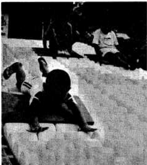
ソロバンライダーは子どもたちに大人気

市役所東側の公園が鶴見公園、大和隣りがわかば公園。阿久根市が昭和五十七年二月から総事業費約四千三百万円で建設していたもので、七月完成しました。子どもたちを中心に、市民の憩いの場所として人気を呼んでいます。