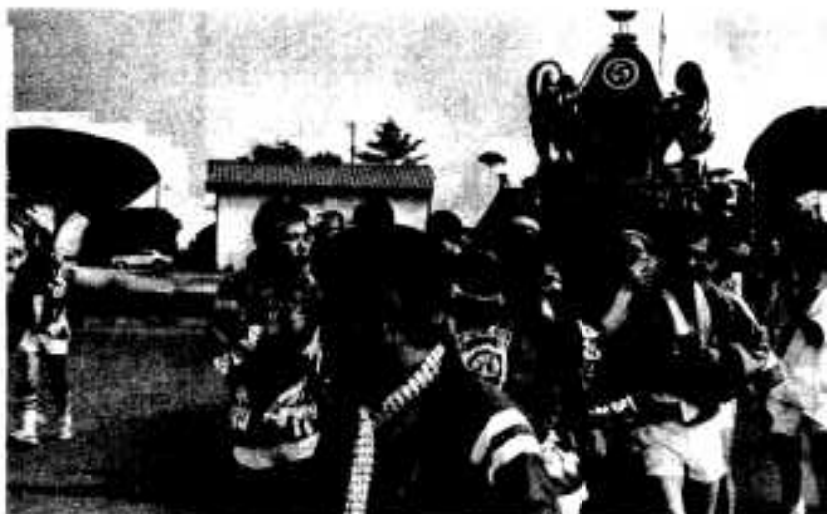
青年会議所のみこしもまちを練りあるく