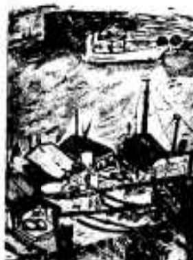
6年 川畑 芳俊