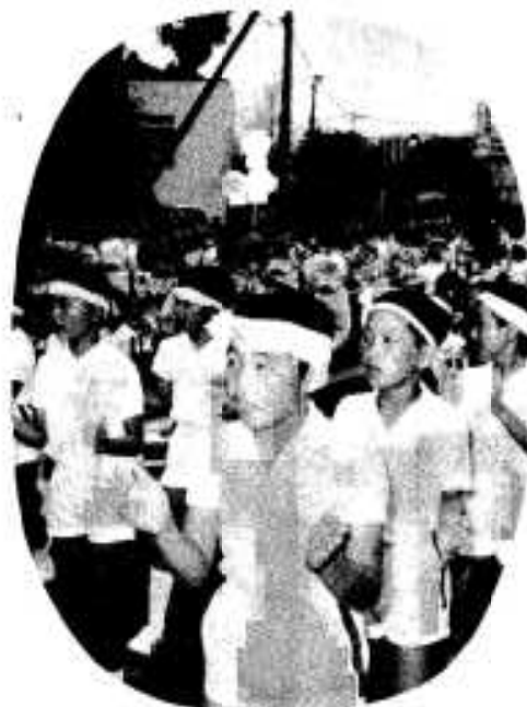
子どもたちもねじり ハチマキで「ハンヤ、ハンヤ」