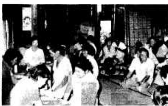
健康診断も公民館で

村づくり、地域づくりに欠かせない集会施設、公民館は、区民とともに歩み続け、区の総合、生涯学習、婦人会、成人、お年寄り等の研修や学習の場所、地区民のコミュニティーの場として広く活用されています。最近では、研修施設と集会所を兼ねた集会施設が多く、各種会合や農作物の集出荷等、区の総合センター的役割を果たしています。これら施設は市内の各区にすべて設けられ、その数は八十八あります。