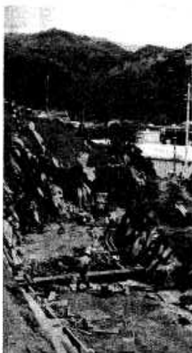
的場付近を工事中

県単事業として、総工費約四億円で、昭和五十四年に着工した馬見塚より大川農免道路は、今、大川の的場地区を工事中で、昭和五十