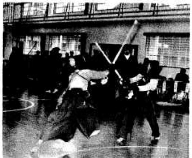
なごやかな親子剣道大会

二月二十日、準人小学校で校区 体協主催のスポーツ少年団親子剣 道大会が行われ、父と子が仲よく 竹刀を合わせた戦い、父親は惨敗、 子どもたちに軍配があがりました。 親子剣道にはスポーツ少年団二 十四人とその父親が参加。小学十 一組、中学十六組が組まれました。 父親のほとんどが剣道は初めて、 子どもから防具を付けてもらい竹 刀を持っていき試合へ。ヘッピリ 腰の父親は一方的に子どもたちに 攻めまわられ防戦に四苦八苦。二 十七戦のうち一人の父親が一度勝 っただけで見事完敗。 「はじめて竹刀を握ったが、子 どんな強か」と父親。