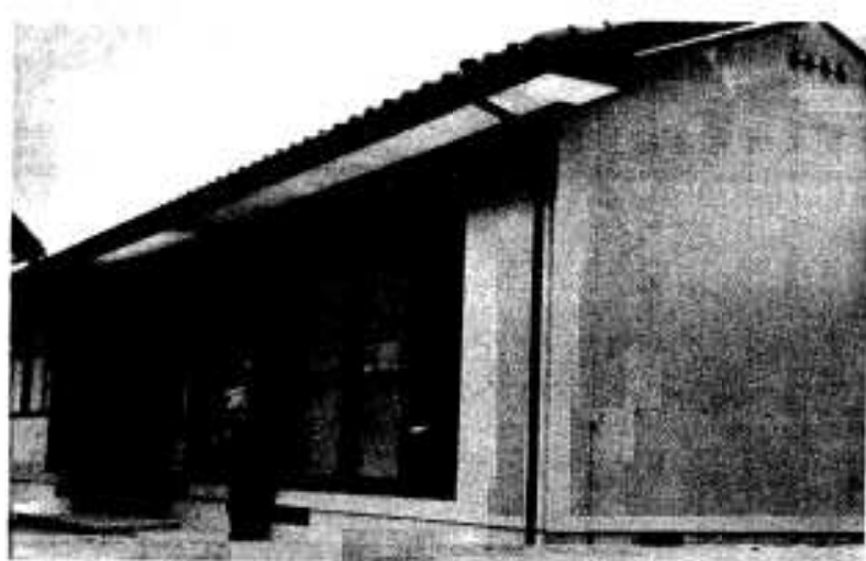
完成した馬見塚集会施設