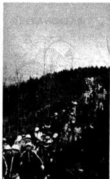
いこいの森を登る参加者