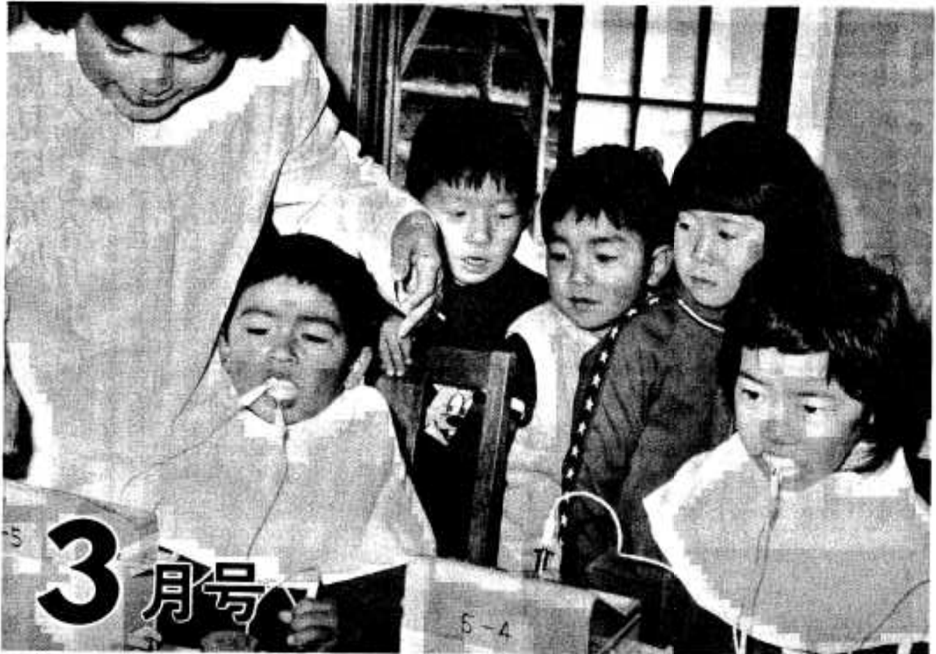
児童館でのフッ素塗布