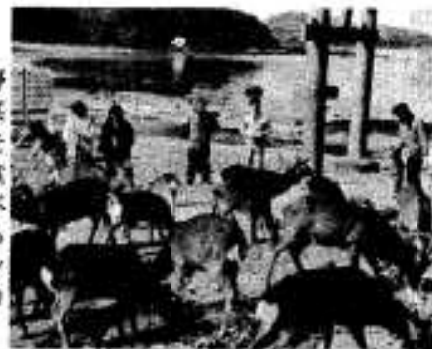
野菜を食べるシカ

二月十四日、阿久根大島のシカ に野菜がプレゼントされ、久しぶ りの青物にシカも大喜び、腹一杯 食べていました。