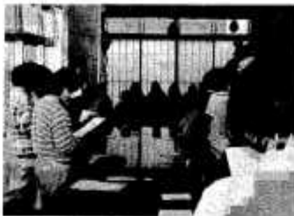
歌を披露する団員

阿久根市青年団の団員二十人 (女子十四、男子六人)が、二月 二十日、市内甚野にある目の不自 由なお年寄りの施設「蓮の実園」 を訪ね、「北酒場」「青い山脈」な どの歌のサービスで、お年寄りと 楽しく交歓を行いました。