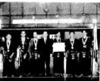
優勝した市役所Aチーム

第十八回西日本都市職員剣道大会は九月十二日、本市の市民体育館で行われ、阿久根市役所剣道チームが優勝、地元開催に花を添えました。