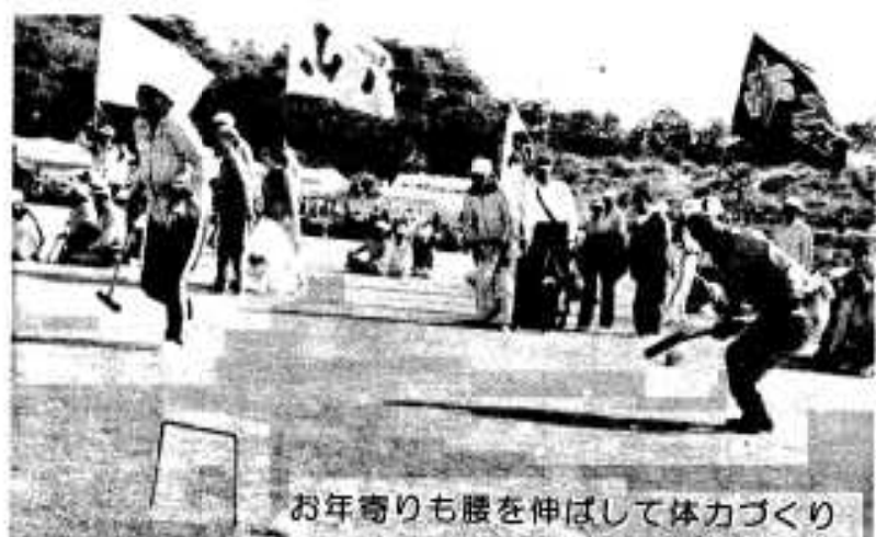
お年寄りも腰を伸ばして体づくり