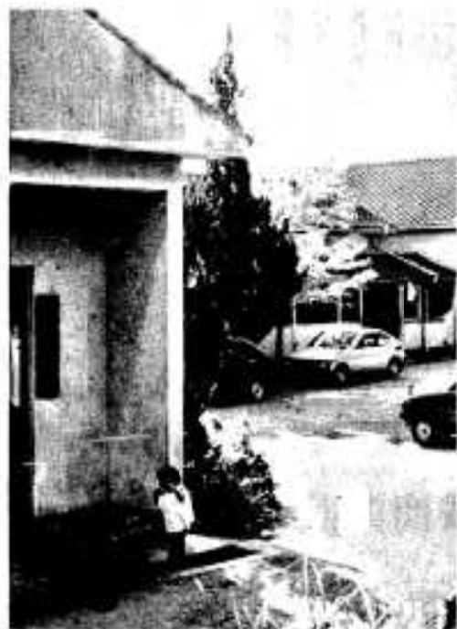
改築される脇本保育所

歳出の主なものでは総務費では市内的場区など五区、三小組合の有線放送補助金十三万円、市民課の印鑑登録原票保管庫購入費な