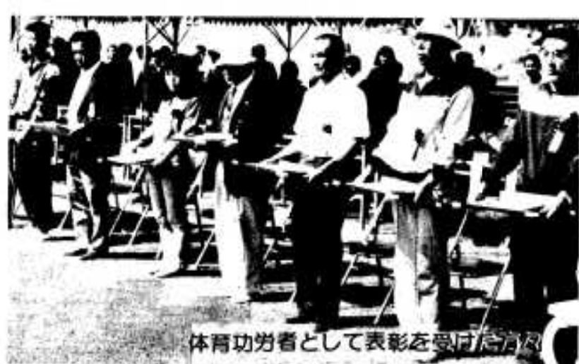
体育功労者として表彰を受けた方々