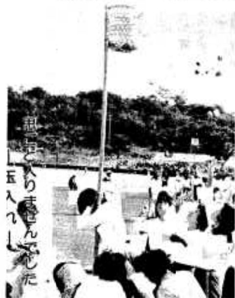
思わぬ入りまきんでした 五人つし