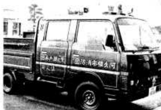
配車された積込車

四月に黒之上、大滝、小滝、八之瀬戸分団に、このほど最近型の黒之瀬戸分団が合併して発足した黒之瀬戸分団に、このほど最近型の積込車が配車され、消防署で交付式が行われました。積込車は二千ccで、購入金額二百五十万円。「単人号」と命名されました。この積込車の配車により市内全分団に積込車が完備され、火災発生時の初期消火に威力が發揮されるものと期待されます。