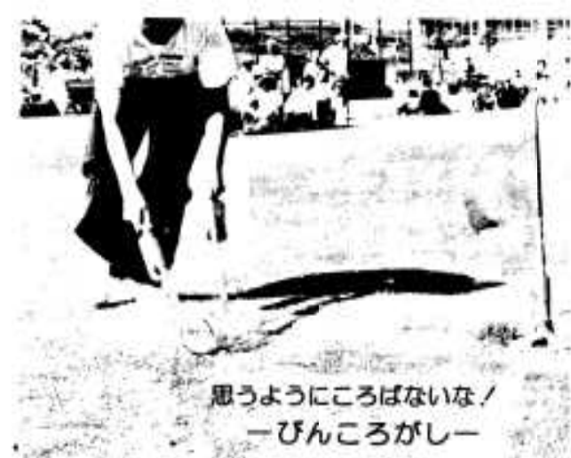
思うようにころばないな/ —びんころがし—