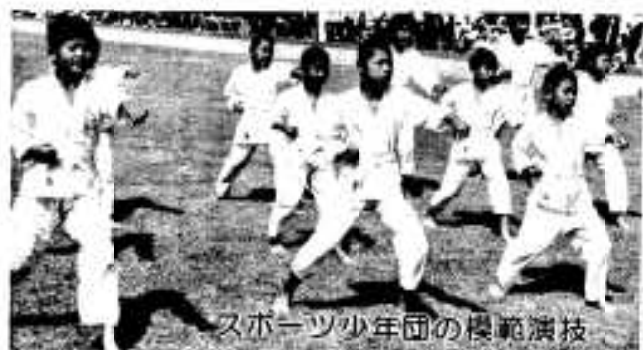
スポーツ少年団の模範演技