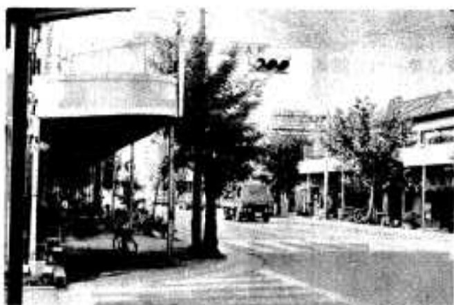
診断を受ける商店街

阿久根市の商業の発展策は何か、また、魅力ある商店街をつくるにはどうすればよいか——現状と問題点を整理して今後の阿久根市の商業を導く「広域商業診断」が、いよいよ十月末より始まります。