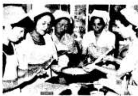
楽しい家庭料理講習

反対に、インスタントラーメンなどの加工食品を食べすぎたり、糖分をとりすぎると体内のカルシウムのバランスが崩れる恐れがありますから、注意しましょう。