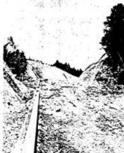
62年完成めざし工事は進む

を経て終点の大川島まで通じるもので、本市関係は延長三・二キロ、事業費も約一億円を予定しています。