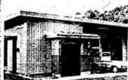
完成した大谷営農研修施設