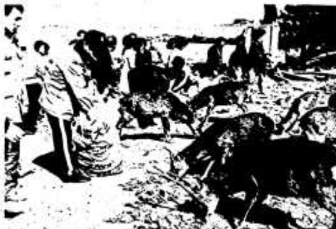
久しぶりの青物をおいしそうに食べるシカ君