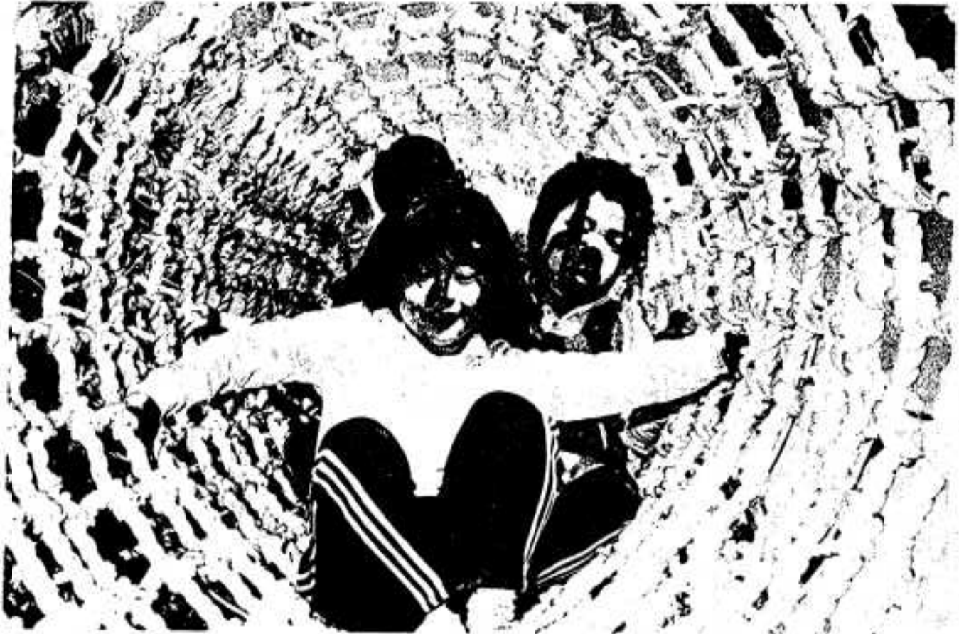
子供たちに人気のドラゴンネット

昭和43年9月20日第3種郵便物認可・毎月1回10日発行 昭和56年3月10日鹿児島県阿久根市役所編集発行1部10円