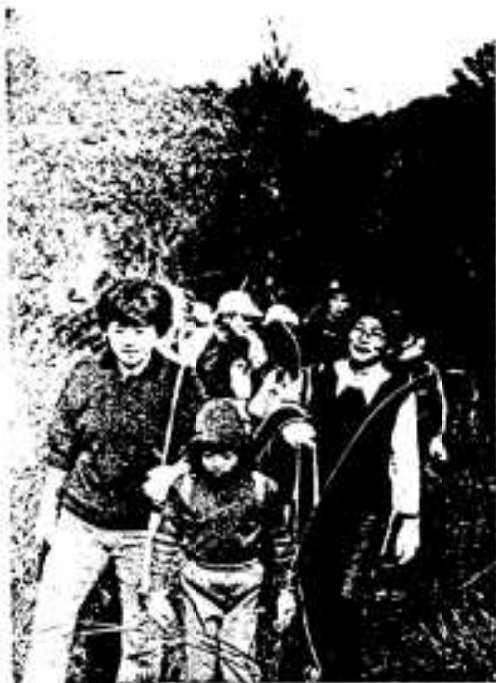
市街地を背に山登りを楽しむ