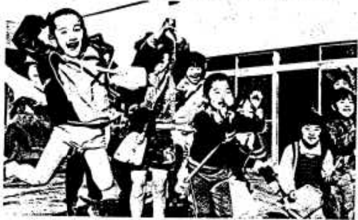
き、一年生交通事故に気をつけがばろう！

新学期まであとわずか 新入学児童をお持ちの家庭では、期待に胸をふくらませながら、入学の準備になにかとお忙しいことと思います。 子どもの入学にあたって忘れてならないことの一つに、交通ルールのしつけがあります。 いままでは、家の近所で遊んでいた子供たちも、学校に通うようになると、その行き帰りを初め、新しい友達などもできるなどして、行動範囲が広がっていきまます。ここで気を付けなければならな