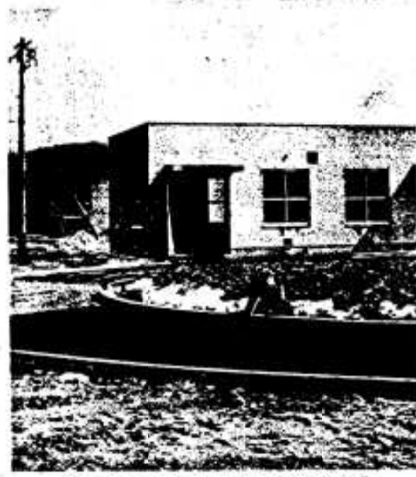
市民の台所を潤す園田水源池も完成

昭和五十五年度は本市水道の飛躍発展の年でした。大林・多田地区を含む上水道第四次拡張事業をはじめ、単人簡易水道の新設工事、鶴川内、臨本簡易水道の改良工事など水道事業を実施し工事も順調に進んでおり、今まで水不足に悩まされていた大林・多田地区へは三月末には給水が始まります。