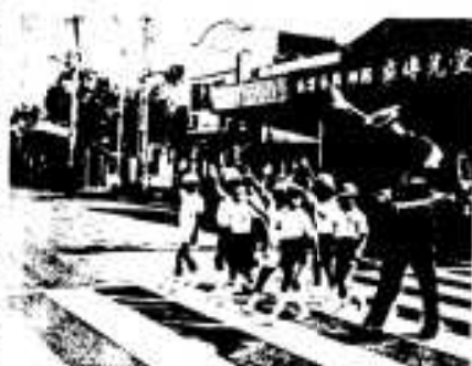
道路の横断は気をつけて

夏休みも終り、秋の行楽シーズンに入りますが、わたしたちの手で子供やお年寄りを交通事故から