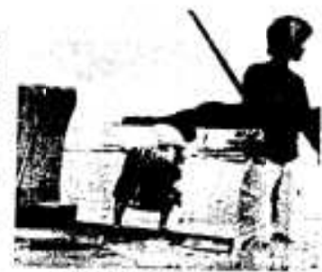
ゴミは捨てないで!!

無リン洗剤は、リンの代わりに新しい成分の材料を使ってつくられます。 また、「低リン」とは、リンの含有量が一定以下に抑えられているので、