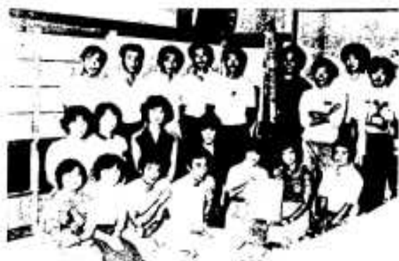
▲県大会で活躍の市青年団

市役所剣道チーム優勝 西日本都市職員剣道大会 阿久根市役所剣道チームは、九月十四日北九州市で行なわれた第十六回西日本都市職員剣道大会で多くの強ごうをくだし初優勝しました。