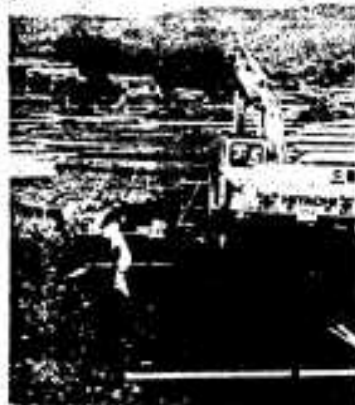
急ピッチで工事が進められるバイパス現場

脇本地区を通る国道389号は、昭和四十六年の黒之瀬戸大橋の開通に伴い、車輦の通行量が多くなってきましたが、この国道は、道巾が狭いうえにカーブが多く危険であり、大型同士の離合には時間がかかり車が数珠つなぎになるなど交通渋滞がつづいており、また