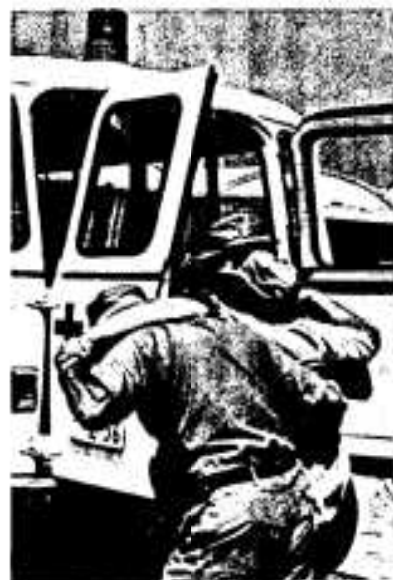
救急業務に活躍する隊員

種類別では急病人が最も多く二百六十六件、交通事故百十一件、一般負傷、その他の百八十三件で一日平均一・五回出動していることになり、市民の五十七人に一人が救急車を利用したことになっていきます。