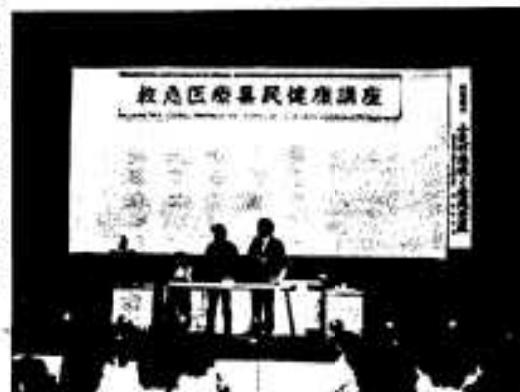
満員の健康講座会場

「救急医療に対する県民の正しい理解と協力を求め、知識をもってもらおう」と、九月十三日市民会館で「県民健康講座」が開かれ北陸地域の各地区から多数が出席して開催されました。