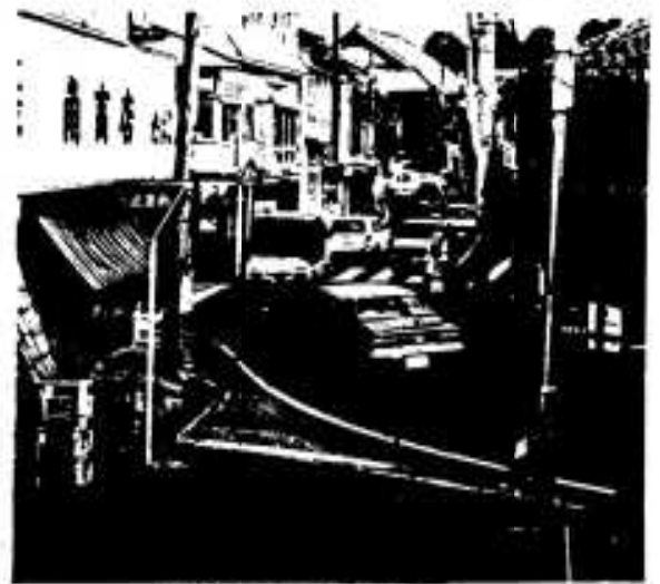
狭くて危険な脇本通り