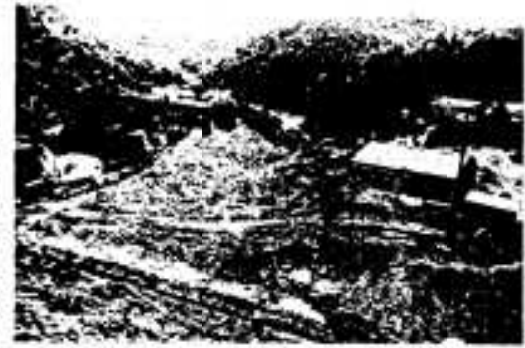
整地が進む尾崎小運動場