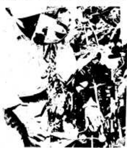
イチジクの収穫に忙しい農家

阿久根市農協では、いま甘くて栄養価の高い「珍果」イチジクが最盛期に入り連日市場に出荷されています。このイチジク、市農協が稲作転換作物として昨年から試験的に取り組んだところ、成育もよく、市場での値が良かったことから本格的栽培に着手したもので、山下馬場、園田地区を中心に三十人の農家が栽培しており、九月初めから収穫に入り、連日タマゴ大のイチジクが市場に出荷されています。今年は長雨と冷夏で成育はよくないものの市場での人気はよく、一箱（一パック五個入り、四パック計）六百円〜七百円の高値がついており、店頭に出まわるところには一ゴ八十円もするとのこと。現在市内では二・八割に栽培されていますが、グループで栽培しているのは県内でも阿久根だけ。