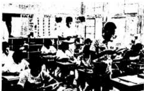
六年生の勉強風景