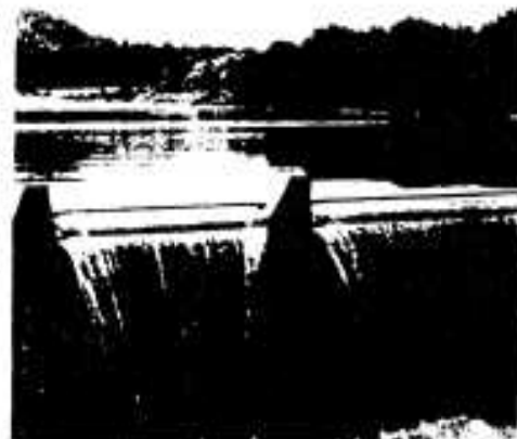
きれいな水は心をなごませます。

湖や河内などの水の出入りの少ない所に大量に流れこむと、水質は肥よく化し、いわゆる富栄養化現象といえます。