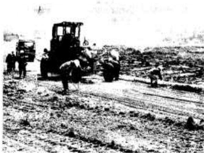
道路なども整備される丸内地区

丸内地区(二十八戸)では、部落の共同施行により、水田のほ場整備事業が行なわれています。受益面積が八・四四割で従来は