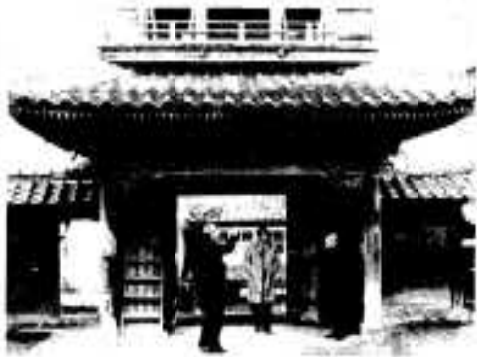
楼門を調査する保護委員ら