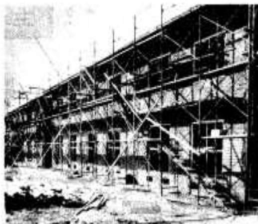
完成間近かの春畑団地

入居申込資格については、住宅に困っていることなど制限がありますので、詳細は、市都市計画課建築係(電話①21211)にお問い合わせください。