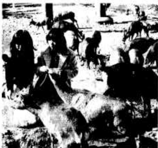
エサをうまそうに食べるシカ

海水浴客のアイールとなっている阿久根大島のシカに「新鮮な野菜をいっぱい食べて」と、二月十六日、市観光協会の関係者約三十人が大島を訪れ、キャベツ、白菜など約百三十きの野菜をプレゼント。シカたちは、贈られた野菜をうまそうに食べていました。