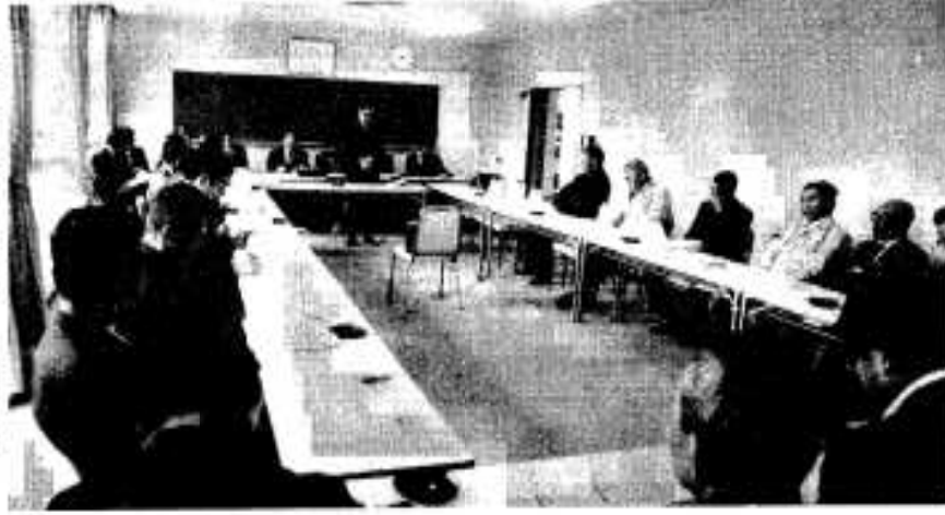
減反問題などを審議する推進会議

しながら実施します。 転作作物は大豆 そば飼料作物が有利 市では、来年度の方針として、大豆、麦、飼料作物を重点に転作をすすめます。なお、当りの奨励補助金は大豆・麦等の特定作物の場合は四万九千円、野菜類は三万四千円です。さらに地域ぐるみ