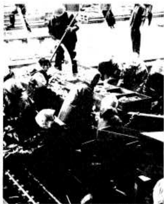
水場のにぎわう阿久根新港