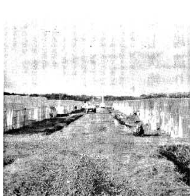
土地基盤整備を終えた鶴川内地区

市長 ただ今、ご意見のあります、二毛作田化、基盤整備事業は、今年の新農業構造改善事業は三笠地区を重点的に実施する予定ですが、生産基盤の整備に努力していかねければなりません。ただ構造改善事業ばかりでなく、農村整備計画の中にも基盤整備が含まれ五十五年度はモデル事業の実施計画、五十六年度から七年度に、約十四億円程度の事業で実施されま