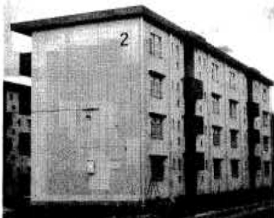
完成間近かの開訪団地

出水土木事務所では一月二十五日まで入居者を募集、一月二十八日抽選の予定で、入居時期は二月一日からの予定です。 入居申込資格については、住宅に困っていることなど制限がありますので、詳細については、阿久根市役所都市計画課か出水土木事務所総務課にお問い合わせください。