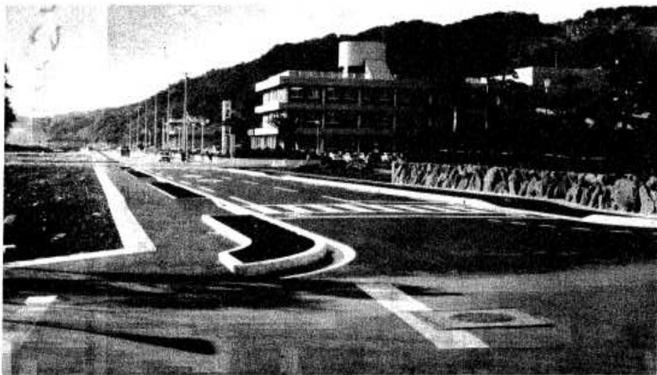
開通した市役所前道路

市民のみなさん、今年も市政に對し、より一層のご協力を賜わりますようお願い申しあげまして、年頭のあいさつといたします。