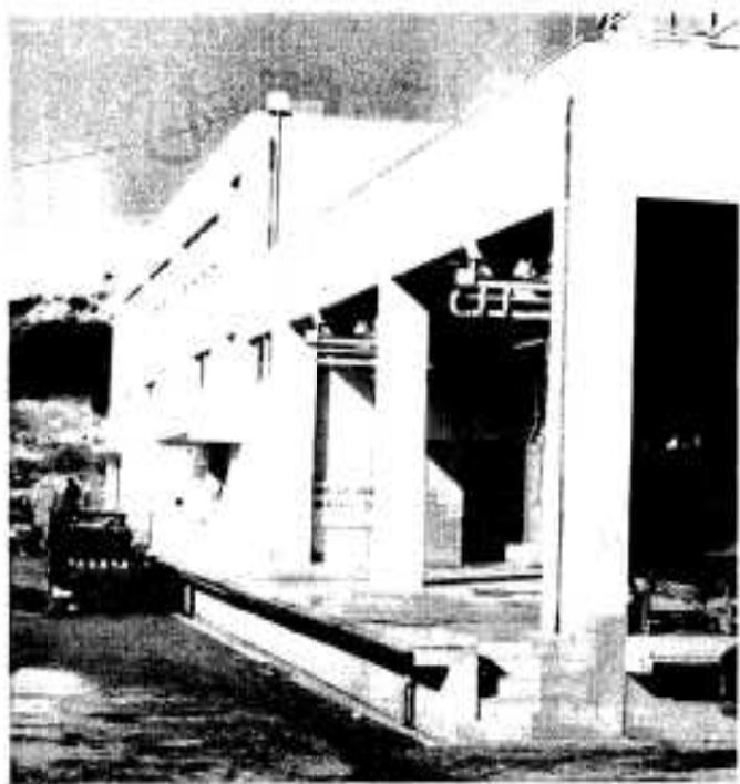
完成した食肉センター

認定二件は昭和五十三年度阿久根市水道事業の決算と、昭和五十三年度阿久根市歳入歳出決算の認定でした。 意見書一件は、鹿兒島の子どもの教育水準を維持するための意見書で、陳情一件は、阿久根市農業協同組合が計画推進している