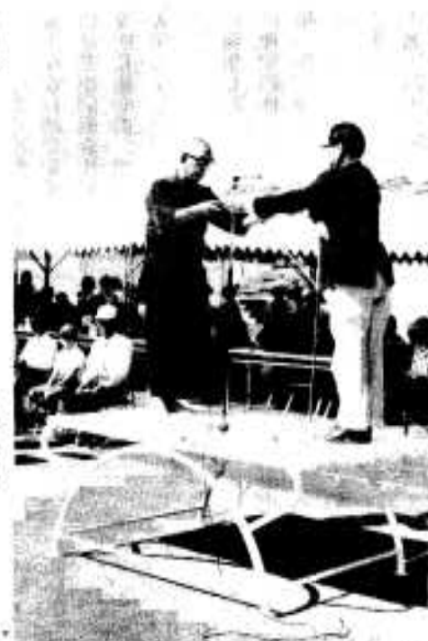
表彰を受ける体育功労者