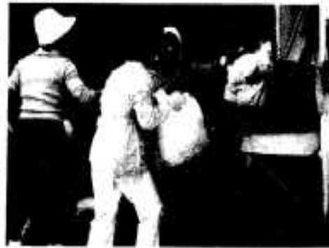
チリ収集を白から体験

などの要望がありました。又、全般的な改善の方法として、チリ収集日を今一度確認する二、区長さんにまめに放送してもらう。