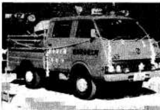
と期待されています。

市消防団の尻無分団と瀬之浦分 団に、消防積み込み車が配車され ました。同車は、小型動力ポンプ 付き積載車で、一台二百三十九万 二千元（うち、国庫補助金百五十 二万円）で購入し「伊勢」「まつ おか」とそれぞれ命名されました。 両分団では、これまで小型ポン プ車だけで出動していましたが積 載車が配車されたことにより、初 期消火に機動力が発揮されるもの