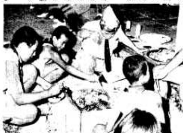
バーベキューを囲む子供たち

山でのキャンプは数多い大口市の子供も、海はめずらしく、子供たちは「この楽しかったことを友達にも教えます」と喜んでいました。十九日からは、阿久根市の子供たちが大口市に招待され交歓が行なわれました。