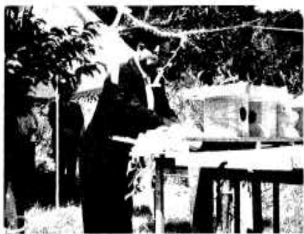
市長川畑市川をささげる玉

なお昨年度は黒之浜簡易水道改良工事が、総事業費三千三百五十二万五千円で、財源内訳、年金積立還元融資二千九百五十万円、一