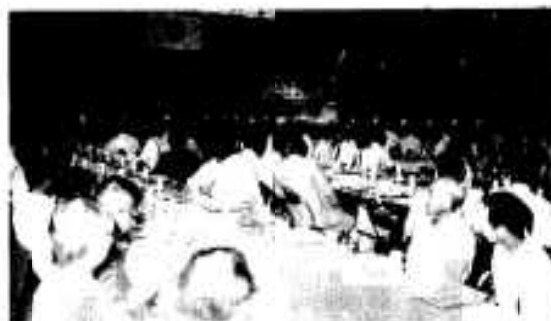
盛大に落成祝賀会

旧事務所は戦前に建設されたもので老朽化がひどく、改築の必要に迫られていました。新しい事務所は鉄筋コンクリート二階建。一階は一般業務の事務所、二階が大研修室、生活改善など研修施設となっています。総事業費一億五千