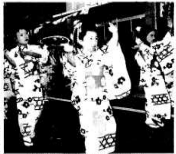
私たちも大人に負けないわ