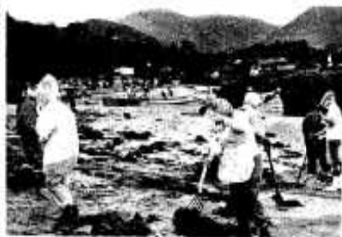
清掃にはげむ部落民

「夏休みを前に海岸をきれいにしよう」と、七月十五日西目高之口では、部落民総出で海岸清掃作業を行いました。一昔前までは、きれいな砂浜であった高之口海岸も、最近では漂流してきた空き缶や空きビン、ビニール、木ぎれなどのほか、不法投棄されたゴミなどでいっぱい。まるで「ゴミ捨て場」となっていました。ほかに適当な広場もないとあって、同海岸の砂浜は子供たちの格好の遊び場だけに「子供たちがけがをしたら大変」と、海岸清掃を行ったものです。同日は部落民のほか、小学校五年生から中学生まで参加。約二百人がスコップやホークを持って、かき集めたゴミは穴を掘って埋めたり、火をつけて焼き払い、汗を流していました。