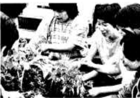
フラワーポットに花を植える青年団

同日は、団員約六十人が新町から市民会館まで国道西側の歩道を歩きながら、マリーゴールド、サルビア、ケイトウなどの苗を一本ずつ大事に植込み、また歩道のゴミやチリの清掃も行いました。