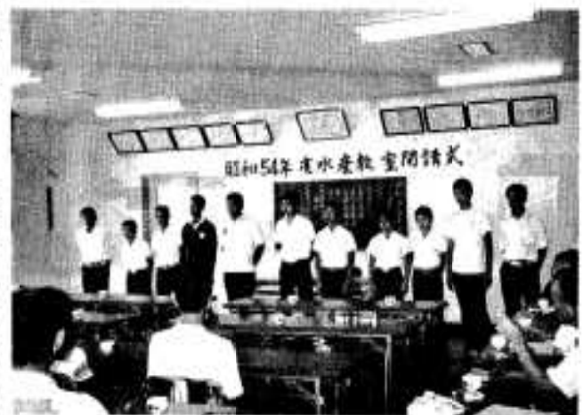
自己紹介で抱負をのべる受講生

ことしは、阿久根中から四人、三笠中から十四人の教室生と、このほか漁業関係者が出席しました