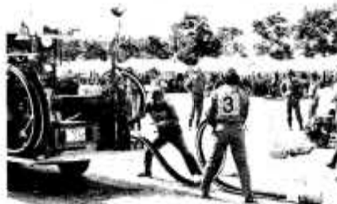
消防団員な懸命な競技

同センターでは、夏休みの始まった七月二十一日、十名の指導委員の方が二班に分かれて、市内の重点地区八か所で街頭指導を実施しました。今回の指導内容はインベーダーゲーム。小・中学校ではゲームの禁止、高校生は遊技場への立入り禁止が決まられています。が、依然として後を絶ちません。同センターでは「インベーダーはもちろん、夜間の外出、喫煙等についても、親が子供の行動に関心をもって指導、監督してほしいです」と話していました。