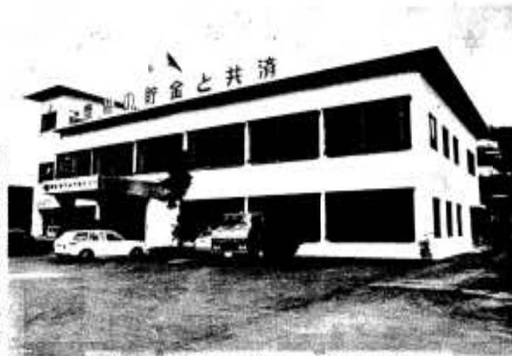
完成した農協事務所・研修センター