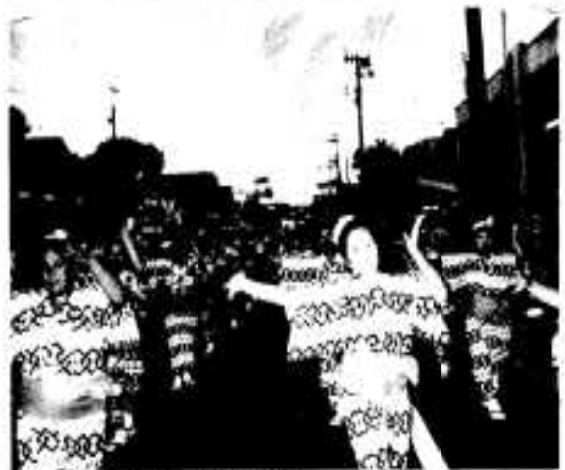
ハンヤ節の本来・浜婦人会