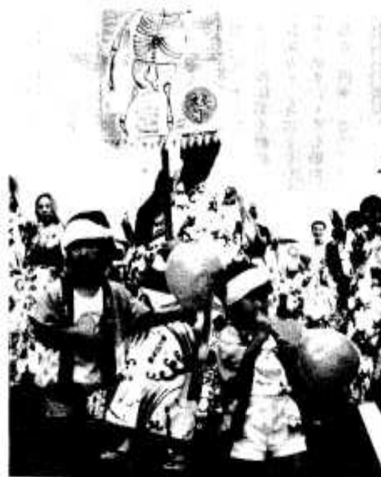
風せん片手に踊る幼児