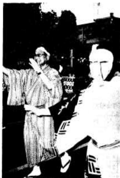
懸命に踊る市長・議長