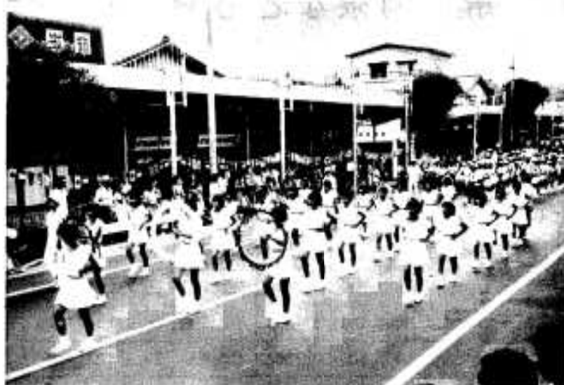
ハンヤ節の前段で先頭を行進するバトンガール