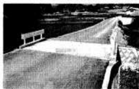
下村瀬之浦線も拡幅され舗装道路へ

北薩衛生処理組合は五月一日からし尿処理取扱い手数料を改定十八円五十四円のし尿取扱い手数料が七十円となりました。なお、取扱い量が百五十リットル以下のし尿取扱い手数料は、これまで四百円でしたが、五月一日から五百八十円となりました。