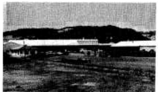
製材工場には近代設備がズラリ

同組合は県を通じて開発事業団資金などを導入、総工費四億四千万円で市宮火葬場近くの水田二万五千三百平方メートルを造成、鉄骨スレートぶきの製材工場と加工工場のほか、木材センターと事務所を建設、原木から製品加工まで、すべてを自動化、製材量は四製材所での処理能力の約二倍に近い月産一千立方メートルを処理しています。