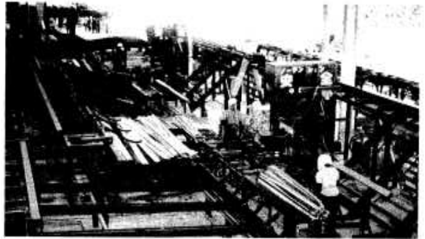
満に完成した阿久根林産事業協同組合の新工場

市内の四製材所が阿久根林産事業協同組合を組織、国産材加工工場としては、九州一の近代設備を備えた新工場を建設、三月から本格的な操業を始めています。