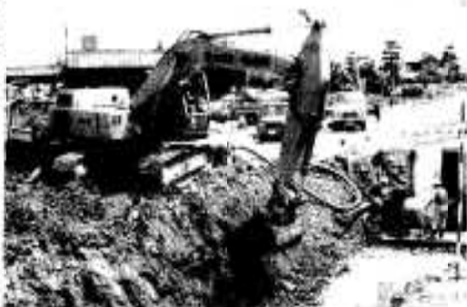
幹線街路交差点近くの排水路も整備 七線の区画街

都市計画事業 代都市づくりを進めている本市で、鶴見川地区十三区を格子型に区画整理して、自然とした宅地に造成しました。