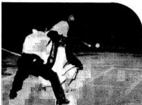
ナイター開きのあとソフトを楽しむ 議員チームと各種団体長チーム