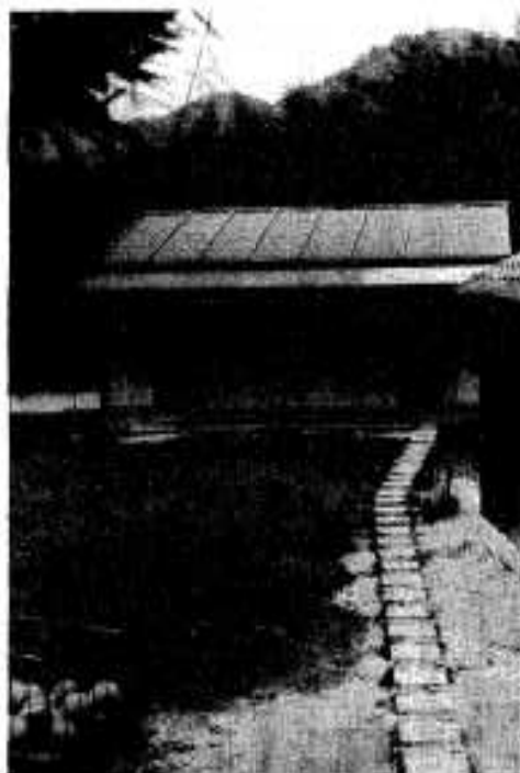
尾崎小屋体は校舎の北東部に建設