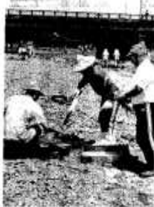
ゴミを燃やす会員たち