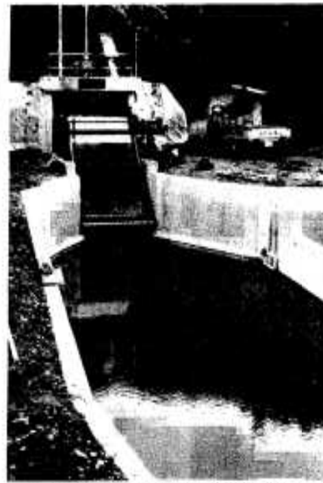
排水トンネルの能力は6月の大雨で試験済み

〔陳情〕 飛松川は上床山などから流れ出る雨水で雨期や台風時にはすぐはらんして、下流の飛松地区の水田は冠水し、住家はす