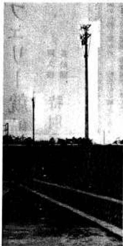
野球場に完成したナイター施設

総合グラウンド野球場のナイター施設が、このほど完成、七月八日ナイター開きが行われました。