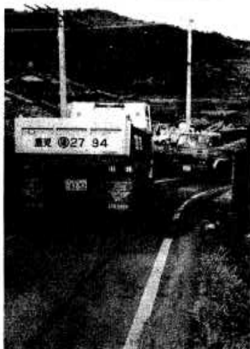
大型トラックの難合に苦勞する国道389号線

脇本バイパスの用地買収を進めている県は、五十二年度までに約八千八百平方メートルの用地と建物三戸を買収。本年度は建物二戸と約二万七千五百平方メートルの用地買収を予定。一部は遅くとも十月頃には着工することになっています。