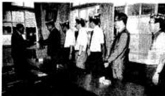
目録を手渡すライオンズクラブの人たち

「いよいよ海水浴シーズン。訪れる観光客も多い。高松川が汚れていては印象が悪い」と、市青年