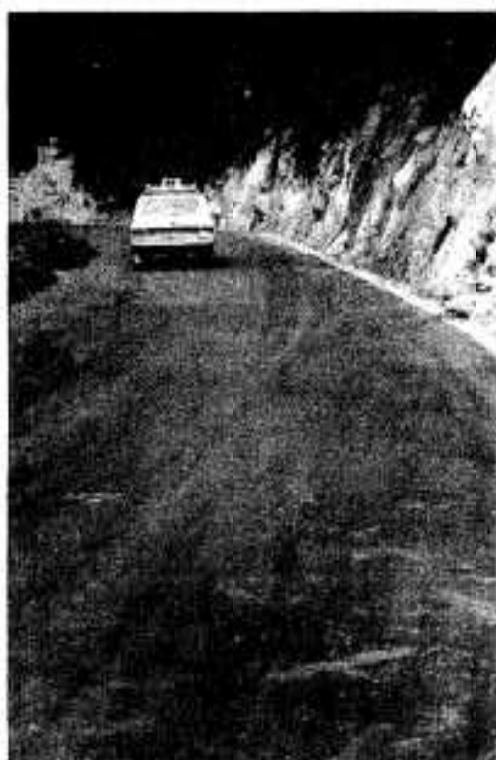
中央線落地区の市道も六本の道路に拡幅

阿久根市の市道延長は北九州市八幡区までの距離とほぼ同じ二百九十五・二キロです。市ではこの市道を計画的に整備するため、昭和五十年に道路整備五か年計画を策定しました。この計画は五十四年度までに舗装率七〇%を目標にした積極的な道路整備計画でしたが、新しい事業などを導入するなど、早期達成に努力してきた結果、四年目で七〇%に達する明るい見通しとなりました。