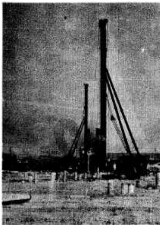
つち音も高く、クイ打ち作業はじまる