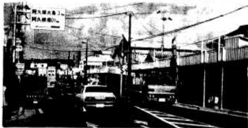
歳末連合大売り出しの始まった市内の商店街