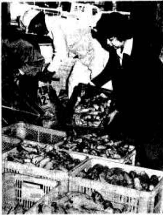
大きさによって選別されるタケノコ

飛松地区たん水防除事業の排水トンネル工事がこのほど貫通、十一月三十日、現地で行通式が行わ