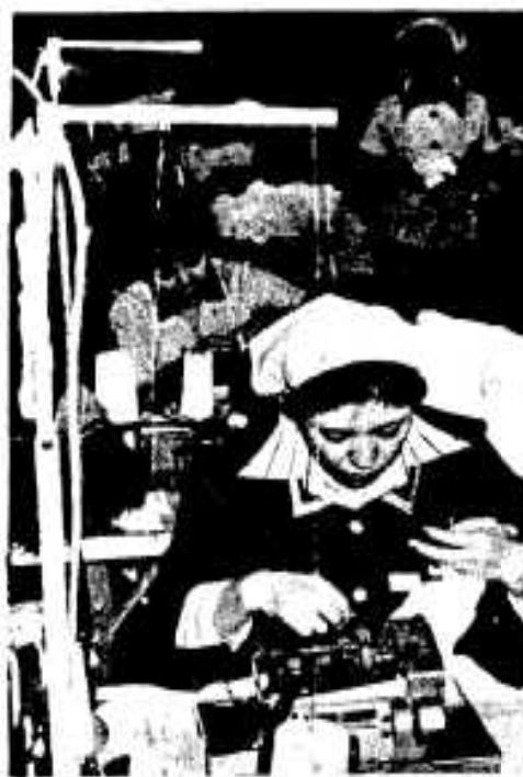
女子従業員にはリターン組が多い

花本 商工業の窓口としましては、私たちの商工業産線になるわけですが、十分に利用されていない面もあるようです。今後は私たちの窓口を大いに利用していただきたいと思えますね。