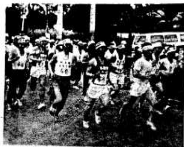
大曲をスタートする参加者たち

「自分の体力に合ったペースで目的の地まで走り抜こう」と、四月十七日(日)田代県道で完走歩大会が開かれました。 当日は阿久根走ろう会の会員など約五十人が参加。なかには主婦三人のほか、遠く鹿児島市や出水市から駆けつけた同好者も参加し、大会を盛り上げていました。 この大会は高松区の大曲を起点に、大田までの往復三回、園田までの往復五回、鶴川内府までの往復十回の三コースで行われ、速さより完走をという趣旨。 午前九時阿久根小グラウンドで