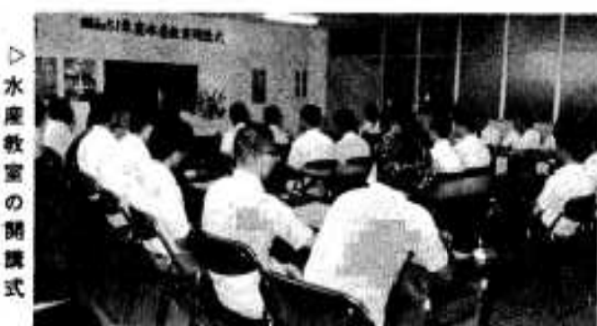
水産教室の開講式