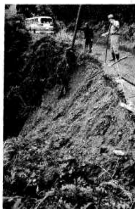
道路も決壊 (尾崎～長野間)

特に台風が接近したり、大雨洪水警報などが発表されたら、天気予報に十分注意し、家屋の補強や宅地付近の排水などを点検するな