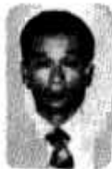
花木商工水産課長

花木商工水産課長 この前、水産試験場が、高之口海岸にアワビの放流をしたんです。ところが、水産試験場の調査では、アワビの