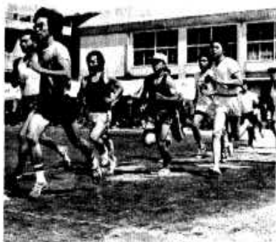
1500 m 競争に 20 人ほど 飛入り