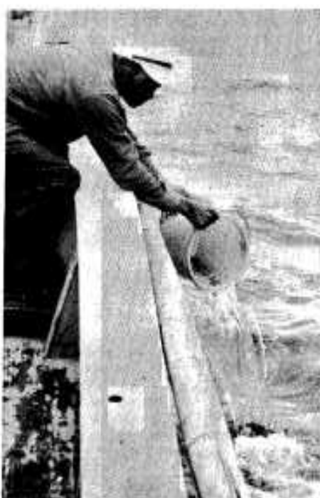
漁類繁殖に稚魚を放流

かせていただきました。公害問題につきましては、県とも連携をとりたいながら、行政指導してまいりたいと思ひます。また、先進地視察などの問題につきましては、今後の課題したいと思います。