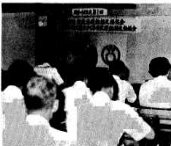
郷土づくりと生活のあり方を見直す協議会

「市民一人一人が、心身をたくましくして、明るい生活と美しい郷土をつくらう」と、日常生活を見直し、新しい生活のあり方を見いだす、新生活運動推進協議会とあすの阿久根をつくる市民運動推