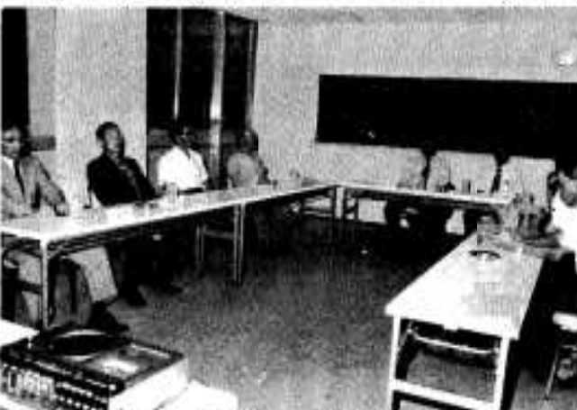
熱心な討論のあった市長と語る会

で、有望な漁業ではないかということ、四十五年に導入しました四十七年には長崎まで研修に行き、非常に成果があったわけですね。最近の水揚げは、良かったり悪かったりで、ことしは特に不漁の状態です。