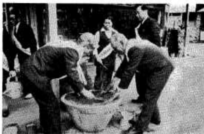
フラワーポットにつじを植える会員