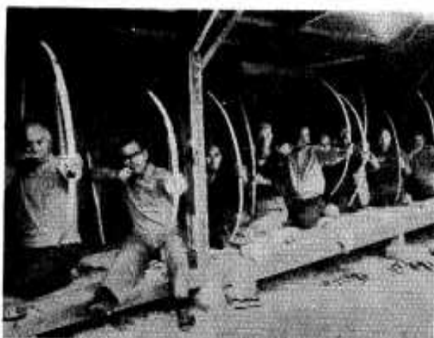
小弓を楽しめるお年寄り