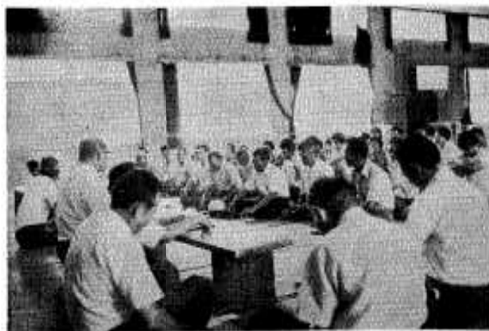
大川中体育館での市政懇談会