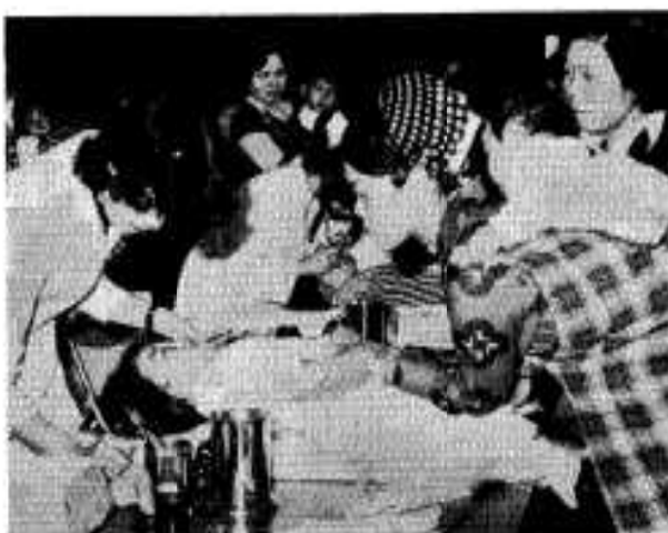
お母さんにつれられて虫歯に予防

虫歯をもっていることになりやす。虫歯は、リウマチ熱、腎臓炎、心臓疾患など全身的な病気の原因にもなります。子供さんの虫歯予防には、次のようなことに注意してください。 1、歯に付着してとれにくいガムやキャラメルなど、甘味の強いものは控目に与えましょう。 2、上歯がはえる一歳前後から、お母さんの手で、ガーゼや綿球を使って口の中の清掃を始めま