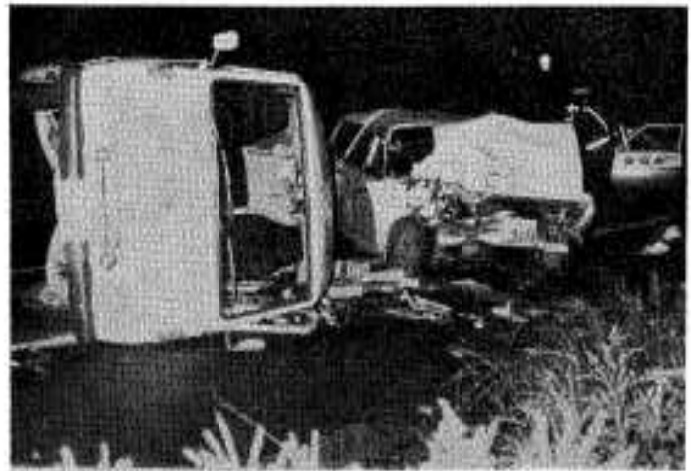
あとをたたない交通事故

成人式は、一月三日午前十時から市民会館で行われます。十一月十三日には代表者会が開かれ、簡素な服装で参加するよう呼びかけています。成人式後は、一時間程度のレクリエーションを行い、お互いに交流を深めることになって