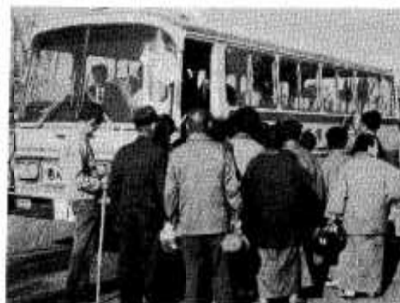
老人バスに乗るお年寄り

大きな老人クラブは乗りきれなかったんです。そこで四十人乗れる老人バスを買って貰いたいとお願ひしていたところ市の乏しい財源の中から特別な措置で購入していただき、みんな非常に喜んでるんですよ。二十七日には、六八の老人クラブの総意で入魂式までやりました」と、老人福祉バスに寄せられている期待は、大きなものがあるようです。