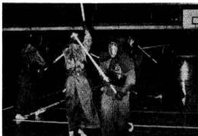
練習にはげむ市青年団剣道部

去る九月七日、鹿児島市の武道館で行なわれた県青年大会で、市青年団剣道部が優勝。十一月七日八日に東京の中央府立体育館で開催される全国青年大会に出場することになりました。