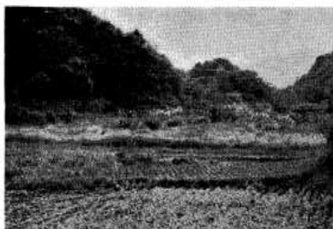
文旦選果場が建設される山下麦地田

文旦選果場は、主産地である尾崎と阿木野の分岐点である山下の麦地田に約七千万円の事業として建設されます。 選果能力は一時間当り五・七トで、文旦にしておよそ一万个に当り、一日に四五・六トの処理ができることになりました。 本市の文旦の植栽面積は約二百畝にもおよび、文旦の生産量や面積において名実ともに、日本一の産地であります。