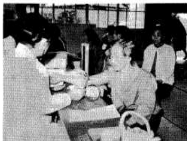
健康診断で血圧も検査

もあり、血圧や心電図・尿検査などがありました。受診者一八八人のうち四七人が高血圧症でした。高血圧症は、食生活が影響するといわれています。そこで次のようなことに注意してください。