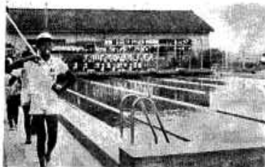
完成した側小ブール

昭和五十年年度地籍調査事業については、脇本地区を実施中で、五十一年三月二十日を目標に作業を進めております。建設課では、四十八年災害復旧工事、山下弓木野線三工区、大造黒之上線と、河川災害復旧工事の山下川二工区がそ