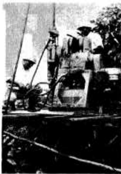
湛水事業の地質調査ボーリング