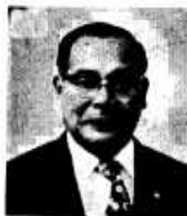
市政報告する市長

市長は、九月市議会のなかで第二・四半期の市政について報告し、住民福祉の市政を推進するため、市民のみならずの層のご理解とご協力を求めましたので、その要旨を報告します。