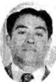
阿久根 (浜) 社会党 牛乳販売 現 44歳