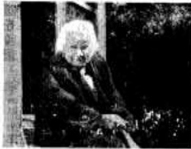
話し好きのツルばあさん