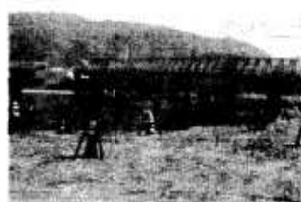
完成になった展望公園

このほど完成となったものです。公園は二段からなっており上部が駐車場、下部には芝を張りフェニックスなどが植えられています。家族連れの下ライプやピクニックには最適な所です。