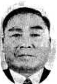
阿久根 (新町) 無所属 商業 現 60歳