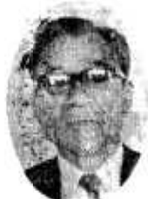
鶴川内 (長野) 無所属 農業 新 63歳