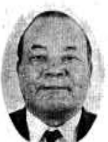
阿久根 (大丸) 無所属 会社社長 新 52歳