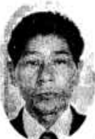
西目 (佐濁) 無所属 水産加工 元 57歳