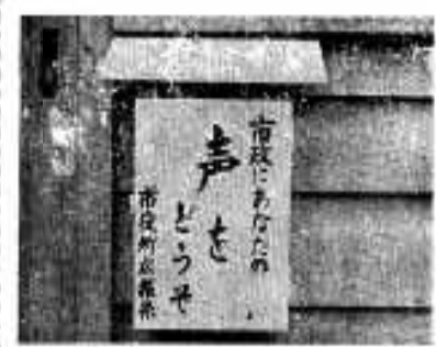
意見をいつでもどうぞ