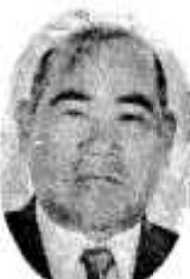
阿久根 (町) 無所属 会社社長 新 65歳