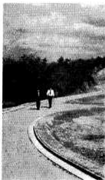
国民宿舎周辺の遊歩道