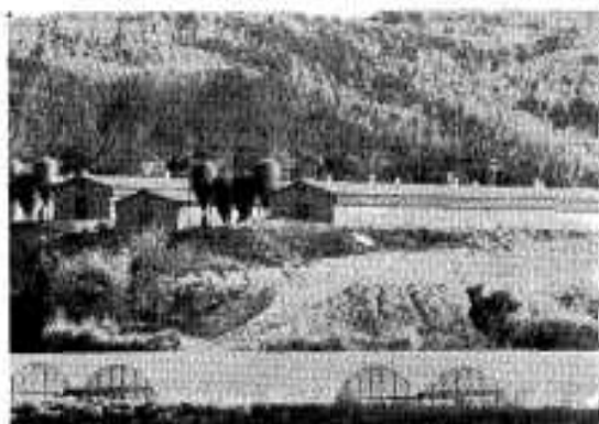
完成なったウインドレス鶏舎