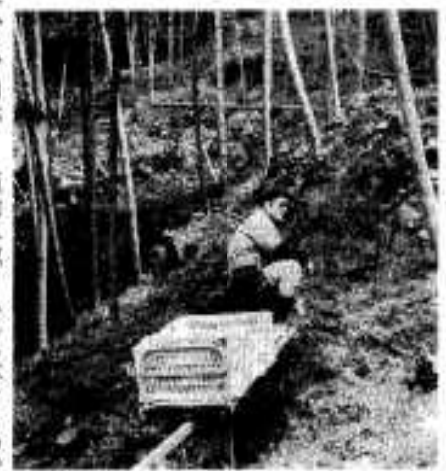
たけの子生産に一役モノレール

ある農業改良普及所及び各種農業団体と密接な連携をとりながら指導力の強化と農業後継者の問題を中心に施策を講じた