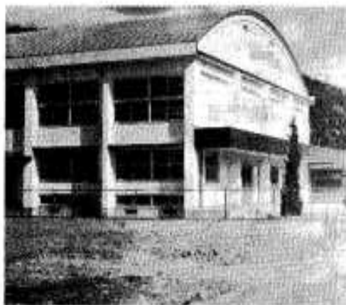
完成なった鎮中体育館