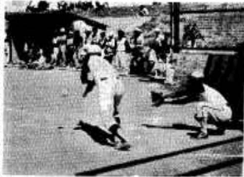
バントヒットなるか