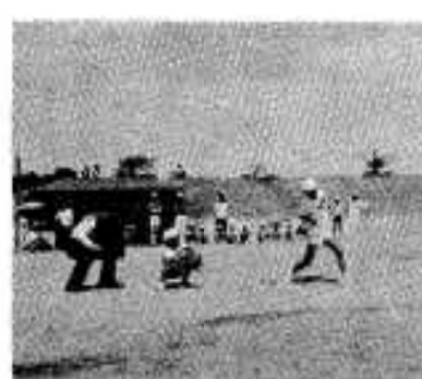
繰りひろがれる熱戦

小学生のソフトボール十三チーム、中学生のバレーボール十二チームで予選を勝ち抜いてきた。