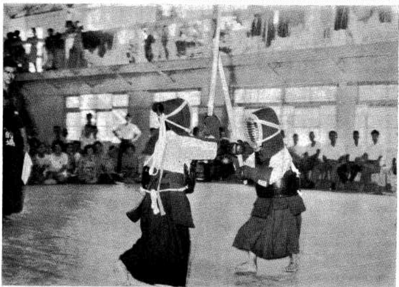
大川校区剣道大会