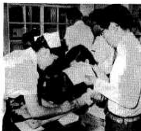
献血の前に比重測定