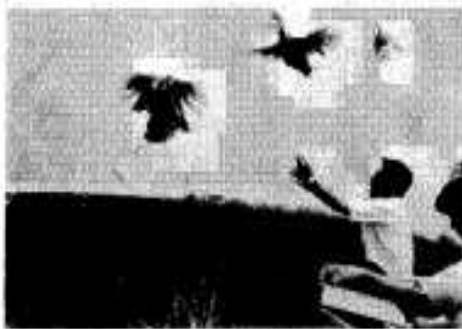
増殖の願いこめて