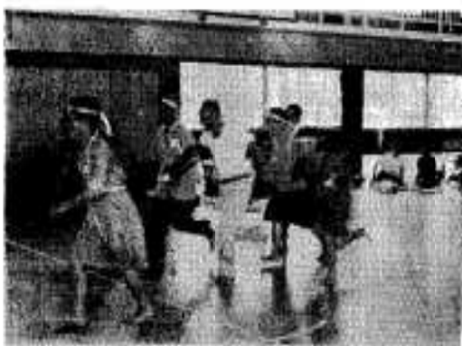
運動会を楽しむ飛松老人クラブ

満六十五歳以上の人で一年以上五年未満の寝たきり老人が本市に五十六人います。これらの人に年間四千万を支給し、また五年以上寝たきりの人五十五人に六千円を支給しています。