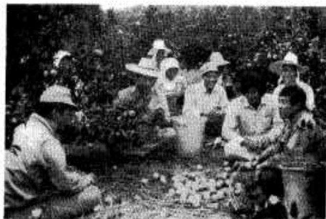
ミカンを食べながらひとやすみ。ことしの出来ぐあいを語り合う楽しいひととき