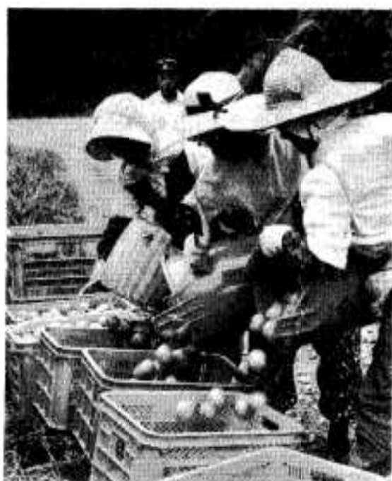
かごいっぱいになると一か所に集められる

それぞれ読書のあとは、自分の理解に苦しむもの、新しい知識、読書から得た新技術、用語の解釈などを、グループ員が一同に集まりディスカッション。これらすべてをミカン栽培に取り入れています。いまではこれらがみごとに実り共同収穫するまで成長、ミカンづくりの楽しさを味わっています。