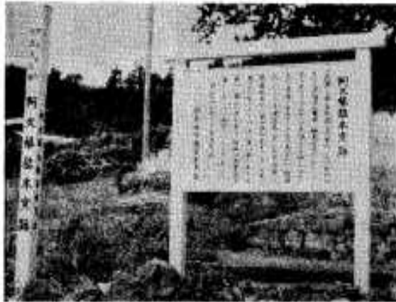
阿久根市文化財保護条例の規定により指定。