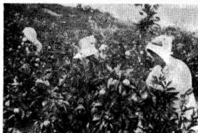
ミカンをもぐ手もかるい