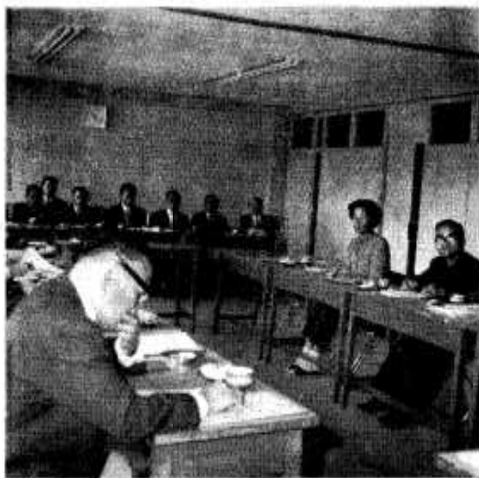
活発な意見も出たモニター会議

◇ 昭和四十八年度のモニター会議が市民会館で開催されました。 ◇ 市の執行部ほか関係課長との間で活発な意見交換が行なわれま ◇ した。まず花いっぱい運動の今後のすすめかた、公害、道路行 ◇ 政、老人福祉問題をはじめ高松川ダム周辺の観光地化の今後の ◇ すすめかたなど、意見や要望など幅広い発言がありました。