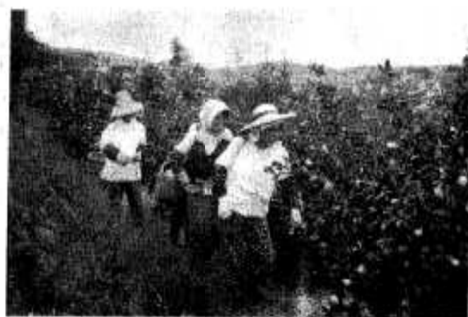
足とりもかるい園の作業