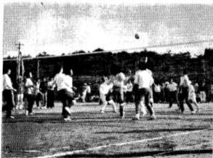
秋空のもと試合に一喜一憂

第二回阿久根市婦人会のバレー大会が、十月十四日総合グラウンドで開催されました。当日は十五チームが参加、その結果、優勝上原、二位尻無、三位多田、四位大丸、敢闘賞高之口・大川でした。