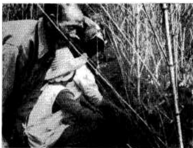
手入れのいきとどいたキヌサヤエンドウ (尻無)

市内大川地区に「高能率生産団地育成事業」の適用を受け、食用サツマイモ、サヌサヤエンドウの