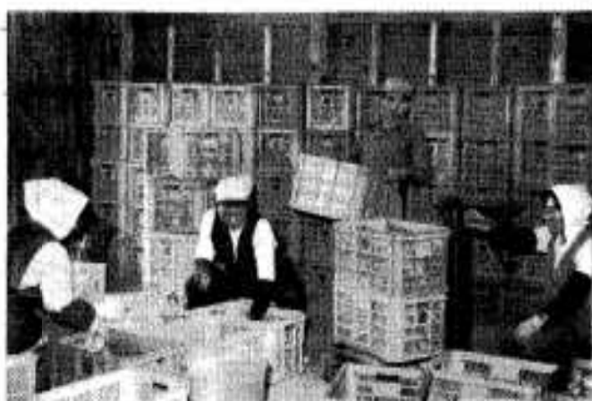
集荷所に集めたミカンは重さをはかり出荷する