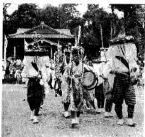
▽ (露払い) 白装束に赤ダスキ、はかま、山がさ姿でカネや太鼓をたたきながら舞う

そのほか、市内にはカネや太鼓で踊る「山田楽」もあります。この踊りも五穀豊じょうを祈って踊るもので、8月3・4日行なわれた夏まつりに踊られ、市民のかたがたにうるおいをあたえました。