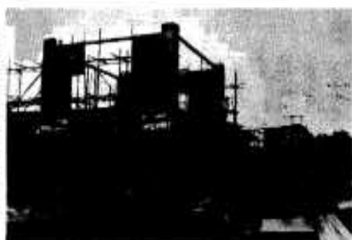
北薩し尿処理場増設工事も急ピッチ

ところが、最近では農家でもし尿を肥料として使わなくなり、ほとんどがし尿汲み取り車に依頼されています。