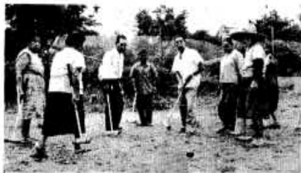
ゲートボールを楽しむ牧内(赤瀬川)老人クラブ

「敬老の日」の九月十五日から二十一日までの一週間は老人福祉週間です。 この週間は、多年にわたって社