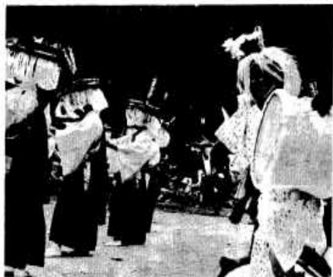
▽△カネや太鼓で勇壮活発に舞う