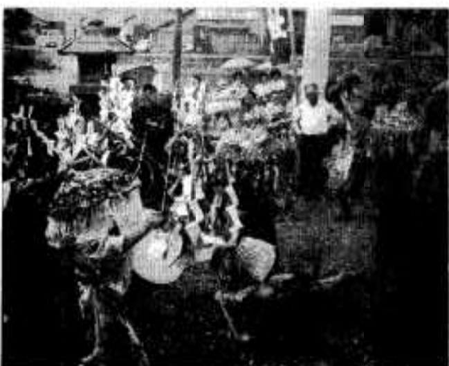
△五穀豊じょうを祈って踊る「山田楽」(藤本古里)