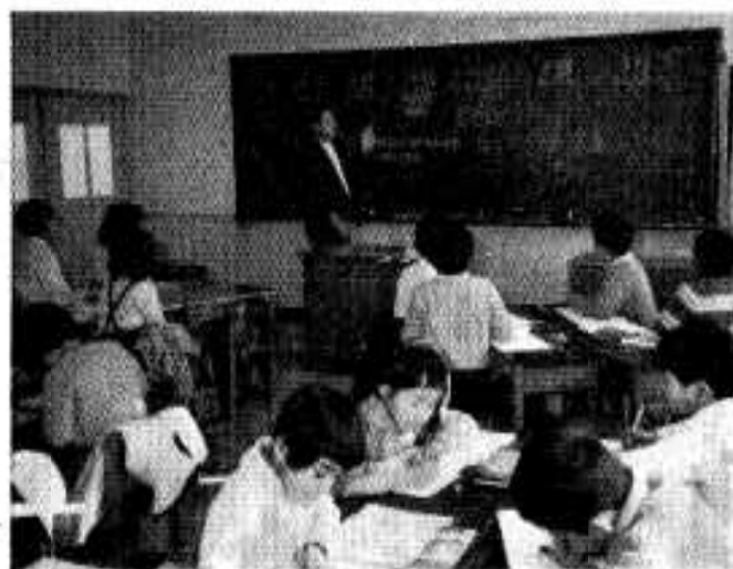
△新しい校舎で楽しく勉強（普通）教室