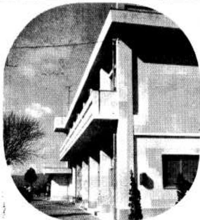
△鉄筋2階建て、日本三急潮流の黒之瀬戸に影を写す隼人小