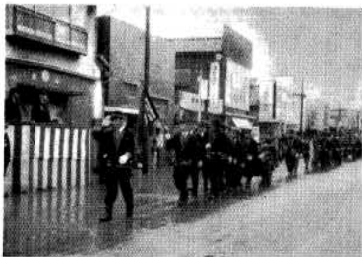
雨の中を分列行進(木町通り)

恒例の消防出初式が、十月七日行なわれました。当日は雨にたたられポンプ操法はできず、市中行進と分列式を行ない、高松川河畔で、三十四台のポンプがいつせいに放水し、出初式を終わりました。