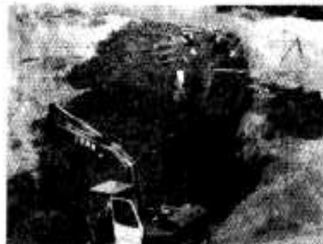
市営住宅の建設現場

市営住宅十五戸が建設されます。建設される場所は、四日高之口(宇春畑・市営冷凍冷蔵庫隣り)に二棟八戸(一種)、黒之浜一棟四戸(二種)赤瀬川下木場一棟三戸(二種)です。