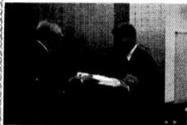
丹宗市長 奥野文部大臣に記念品を渡す

丹宗市長は、さる1月7日、昭和48年度予算陳情のため上京従来から親交のあった「奥野文部大臣」(元自治者事務次官)邸に空港から直行、大臣就任のお祝いを申しのべました。その中で文教改革について、