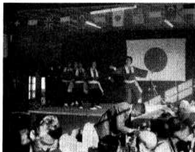
△校区民も新校舎の完成に大喜びささやかな祝賀会も行なわれ、婦人会の踊りも行なわれました