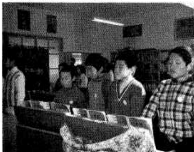
▽校区のかたがたが一同に