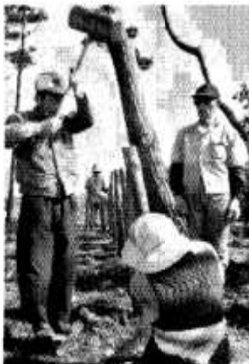
防風網の抗うち作業

これまで、海水浴シーズン中は松林の中でキャンプができましたが、保安林改良事業が実施されると、キャンプも禁止されます。