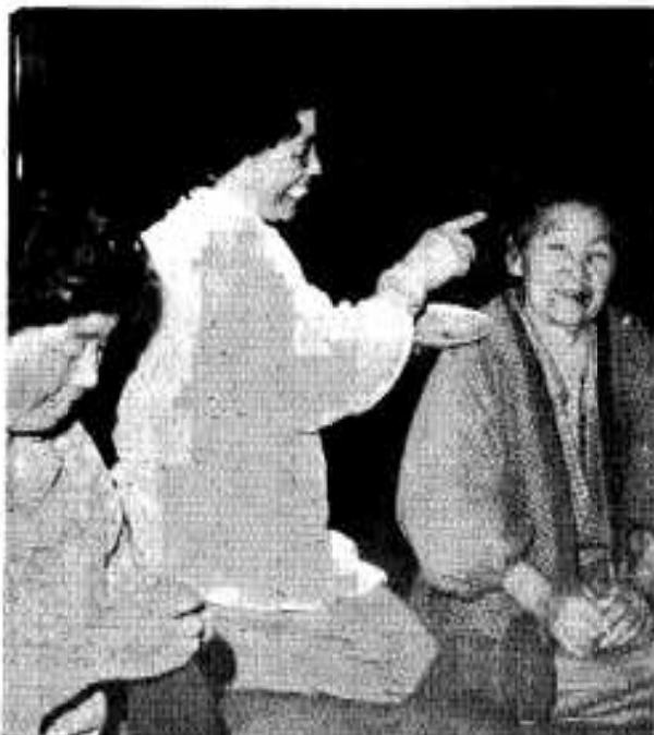
老人家庭を奉仕するホームヘルパー

規模な個別経営からなる施設園芸の団地をつくり、すぐれた近代的なハウスや機械、技術を使い効率の高い経営を営むことをねらいとしています。 また一方の農家総合指導事業は自立経営志向農家、安定兼業志向農家、離農志向農家の三つの進路に向け、それぞれの進路に進めようという、つまり、学校教育に似たような、進学、就職、家庭に進路がわかれていくようなものなのです。 これからの企業農家を今後さらに推進するとともに、営農資金貸付け事業も、わくを拡大するとともに、利子補給の大幅なかんわも考えていかななくてはならない問題だと思えます。 中村 つぎに水産業ですが、県内でも有数の産地をもっているわけですが、今後の課題などについていかがですか。