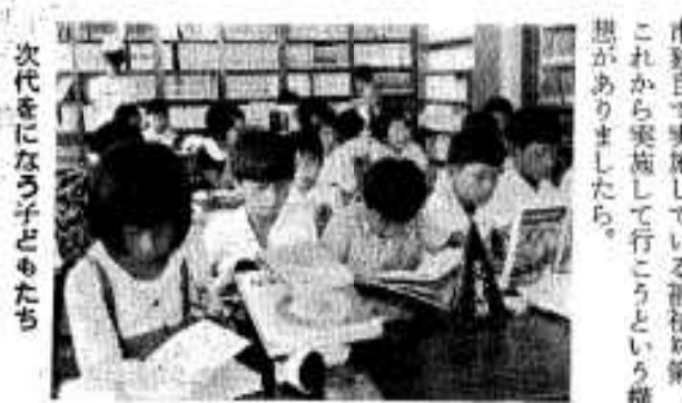
次代をになう子どもたち

とくに昭和四十年代においては懸案であった児童手当制度が確立し、わが国における社会福祉の整備は欧米先進国なみの水準に高められてきたとみる事ができると思えます。 このことは、社会福祉思想にも大きな変遷をもたらし、従来の生