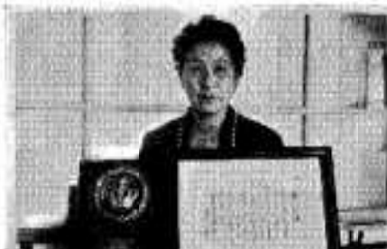
表彰状とタテテを手に喜ぶの婦人会長