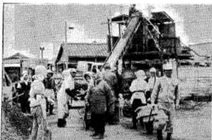
▷道路整備も急ピッチですすめられている