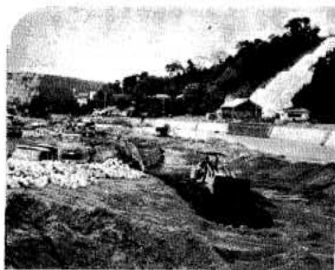
▷高松川改修も急ピッチ

けやすい土地でもありますので、これらに対する対策なども急ピッチですすめなくてはいけないと思つています。 まあ、行政には、小さきままな問題がありますが、すべての問題について、近視眼的に見ないで十年先、五十年後の我々の次の世代にとって、祖先はこうやっていてくれた」と感謝されるような大きな構想で、行政をすすめてまいりたいと思えます。 そういう意味で、市民のかたがたのご理解、ご協力をお願いしたいと思つています。 市民の皆さん、今年一年がすばらしい年でありませう心からお祈りいたします。