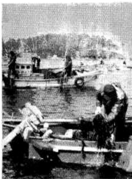
天然ワカメも有数の産物です

①「はちみつ」とは、純度百%のもの②「加糖はちみつ」とははちみつの含有量が60%以上のもの③「ローヤルゼリーはちみつ」とは、ローヤルゼリーを60%以上含むもの。選ぶ場合は価格の高低ではなく表示のしっかりしたもので、公正競争規約に適合した商品には「公正取引引き」というマークが添付してあるので参考にするとよいです。