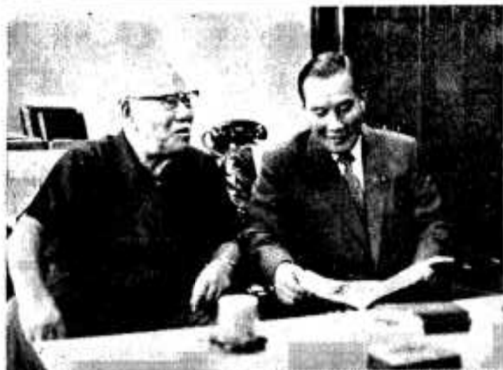
↑9月8日から15日まで上京し三原総理府副長官と災害激甚地指定のお礼と何久根市の災害復旧状況を語り大型冷凍冷蔵庫の起債関係に関係者に陳情これを折り込ませてきました(総理府副長官室で)