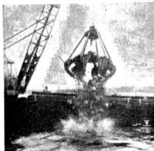
ワカメ増殖をはかり石を投入(大島前付近)

九月八日から十五日にかけて、建設省、自治省、総理府ほか関係機関に災害激甚地指定のお礼と、ただいま計画している、冷蔵冷蔵庫建設の起債がつくか、あやぶまれていると県から連絡を受けたので、これを各関係者に折衝し、これをおり込ませて参りました。 以上で本年度第二・四半期の事業執行状況を要約して、ご報告を申し上げます。