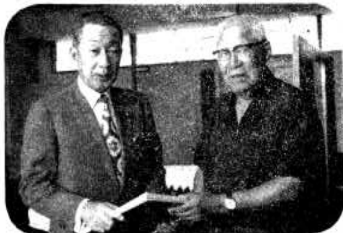
沙田副総務長官(災害対策本部長)と災害激甚地指定のお礼をのべる(副総務長官宅で)