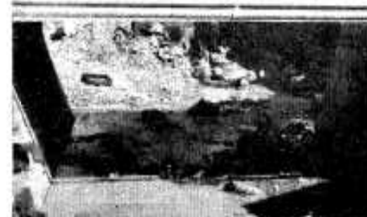
集中豪雨で流された柿内橋(尻無)完成

十月から十一月にかけて全国物価統計調査が行われます。消費者物価についての第二回目の総合的、基本的な大調査です選定された店舗でのご協力をお願いします。