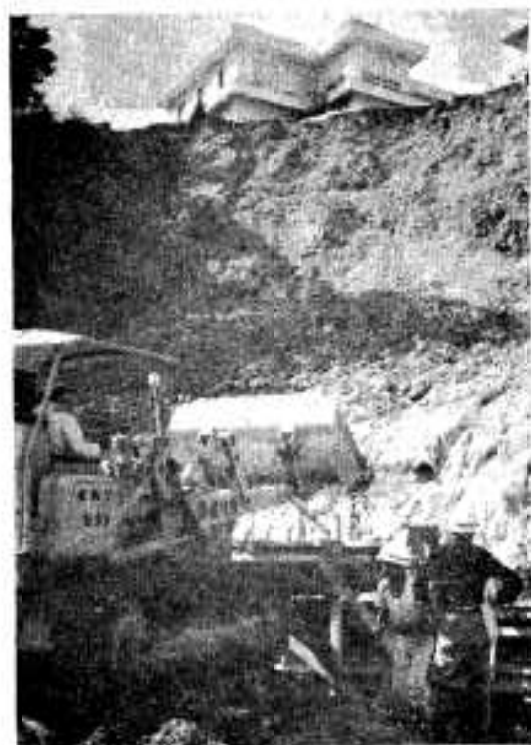
「老人ホーム(高松)の崖くすれの復旧工事も急ピッチで進められている

豪雨と台風19号災害から早や2カ月、連日災害復旧にブルドーザーが、トラックが、ミキサー車が、土けむりを上げ復興への土おと高くひびかせている市内の市道・農道・河川・橋といまだかつて受けたことのなかった数多い災害にうちひしがれたが、県をはじめ国、各関係機関に陳情と災害視察者をはじめ、関係者をお願いした結果、災害激甚地に指定され、いまでは復旧工事も軌道に乗り順調に進んでいる。そこで今月は災害復興とその土おとを取り上げてみました。