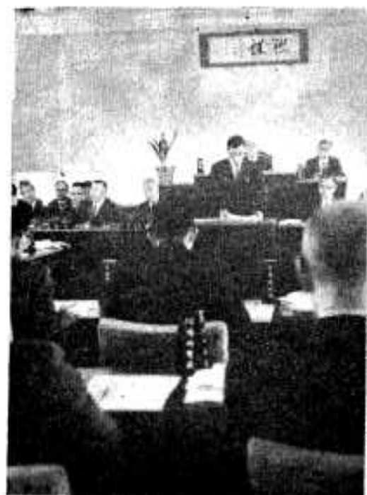
水道使用料について建設委員長報告を審議する議会

●労働費 二百七十三万円 歳入においては、市税二千二百万円、地方交付税四千八百八十五万円、国県支出金一億三百三十二万三千円、市債六千六百二十万円その他をもって充ちました。