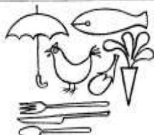
全国物価統計調査

十月から十一月にかけて全国物価統計調査が行われます。消費者物価についての第二回目の総合的、基本的な大調査です選定された店舗でのご協力をお願いします。