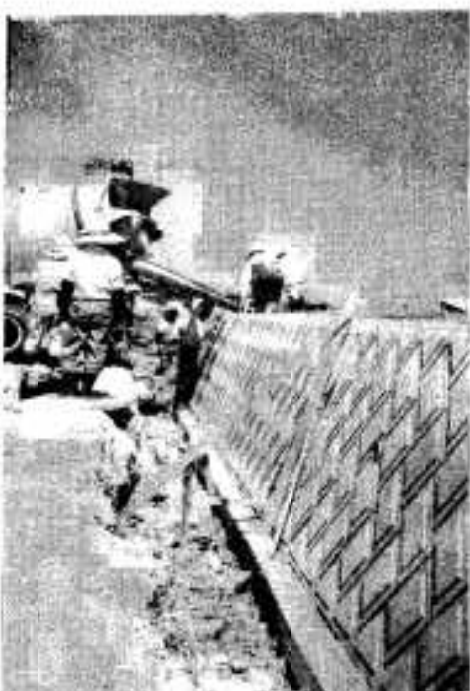
北側スタンド工事、総合グラウンド建設

市長は、就任以来12カ年、毎年激変で健全財政を堅持しつつ、住民の福祉人福祉対策・教育文化・農林水産・商第2回定例市議会で、つぎのように施