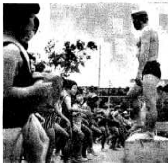
水に入る前に準備体操