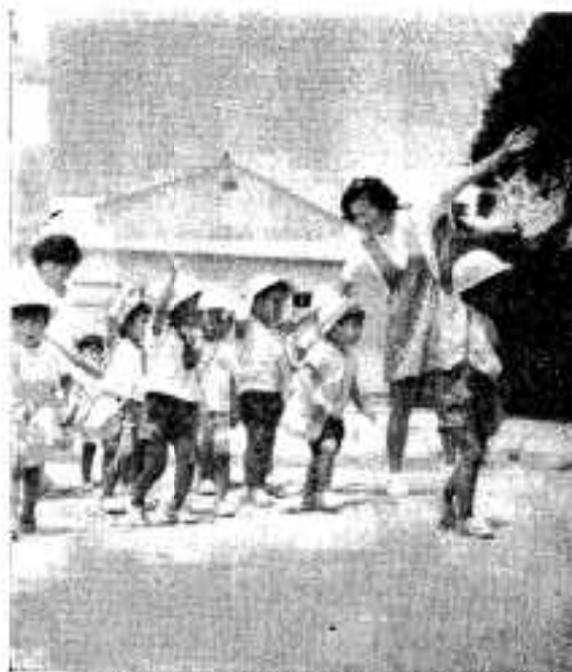
△きょうはこれでお別れ道路を渡るときは右を見て、左を見て、手を上げて、左側を過ぎて帰きましょう。