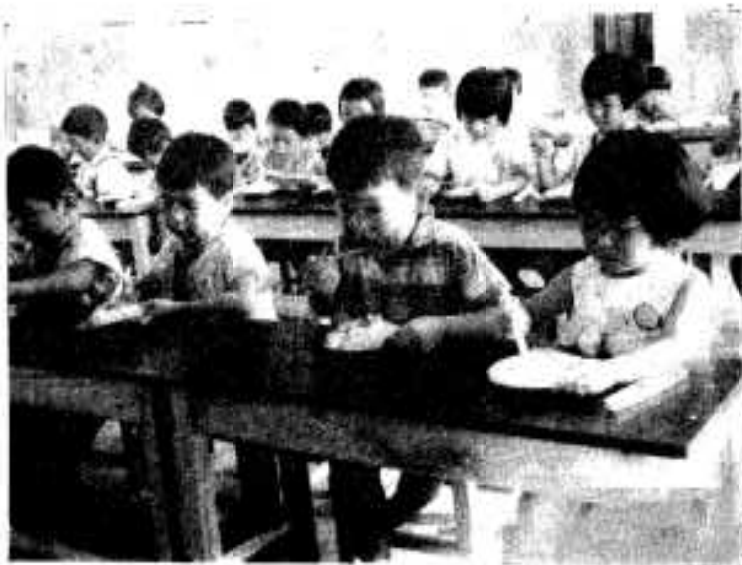
△お昼はオムライス、食べ終わったらこれからおひるね。