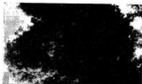
阿久根小南側がけにあるあこうの木

「われわれの学校も変わったもんだ。昔のまま残っているのは、ほんとに、この「あこう」の木一本だけとなってしまった」