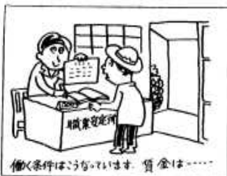
働く条件はどうか、賃金は……

高血圧症の人は別として、味を少し辛めにするとう食欲を高めることができます。また梅干や酢のものなどをとると、胃酸の働きを助け、Eと共同で体の機能を良くし、疲労を回復します