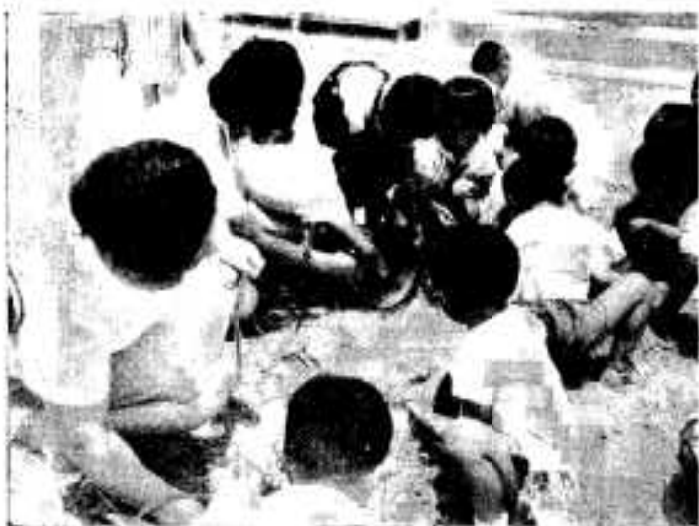
△楽しい砂遊び、山をつくり、木を植え、川をつくり……。