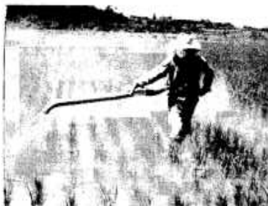
散布は風向きを考えて

「長時間の散布」 「布は危険」 いままでは、なんと使ってもどうもなかった農薬も体調がじゅうぶんでないときには中毒をおこしやすいものです。 毒性の少ないものや、使いたれた農薬でも必ず、つ