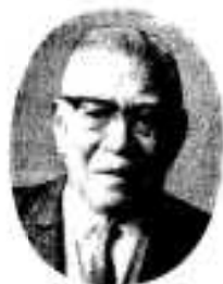
市長を報告する市長

四十六年度の市政を推進する重要な事業計画をご審議いただくにあたりまして、わたくしの所信を申しのべ、議員みなさまがたのご意見をうけたまわり、市民のより一層の福利増進をはかりたいと存じます。