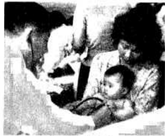
相談は専門的に指導