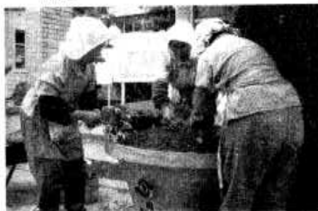
市内100個のフラワーポットにマリーゴールド、松葉ボタン、ケイトウなど植えられ、わたくしたちの目を楽しませてくれる。

毎日30人の部員が国体めざして激しいトレーニング ○夏期大会47年9月17日～20日 ○秋期大会47年10月22日～27日