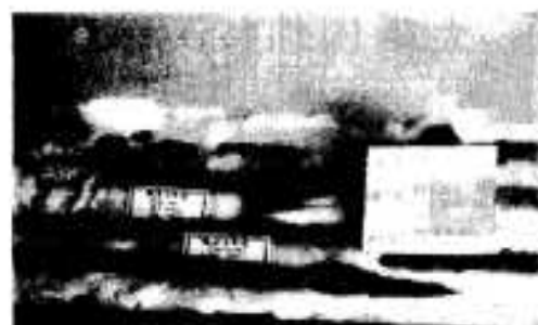
市立図書館に展示してある直刀

脇本の新田ヶ岡一帯は以前から大昔の墓のあるところとして付近の人たちはいろいろのことをいい伝えてきました。