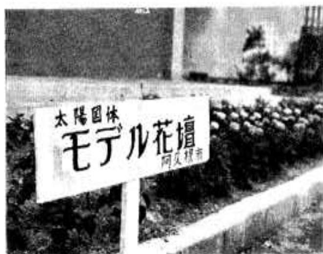
ボクシング会場（市体育館）につくられたモデル花壇

太陽国体を契機としてはじめられた「花いっぱい運動」も、ことしで3年目に入り着々とその成果はあがりつつあります。阿久根市でも市境と駅前、市民会館広場に広報塔を設置するとともに、100個のフラワーポットを市内に配置、日付板、モデル花壇など、国体ムードも日1日ともりあがっています。阿久根はボクシング会場になっており、いまでは農高、高校を中心とした30人の部員が国体選手めざして毎日練習に励んでいます。