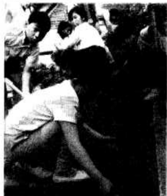
市内小・中学校生徒も学校の玄関庭園を花で飾り、花いっぱい運動に一致