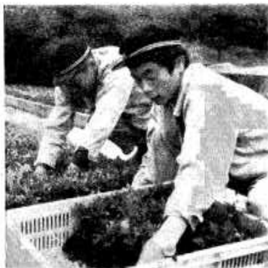
農高生徒によって育てられた花の苗は、市内各小・中学校および市内花いっぱい用として配布される。