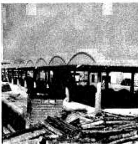
▲阿久根漁港荷さばき場も完成

ことがたびたび、これを解消するために拡張されたものです。荷さばき場は鉄骨スレート造りで、二千五百平方メートル、長さ百メートル、幅十三メートルのものです。