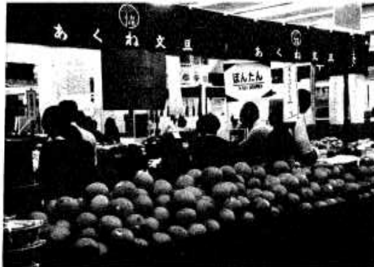
南国のかがおりがいっばいの展示場

自然食を喜ばれるいま、あおさのり、ときかのり、ひじきなどの海藻類は改めて見直されようとしている時期でもあり、加工のしかたにくふうすれば、今後大いに市場性があると考えられます。