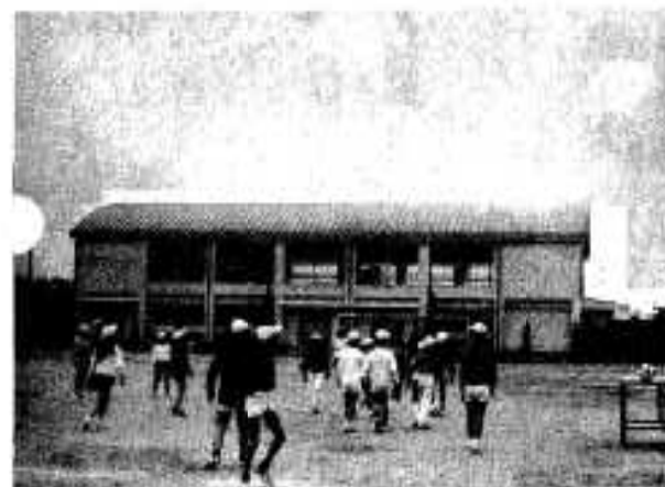
▲卒業式を待つ新しい西目小屋内運動場

まことにまった西目小屋内運動場が二月二十日完成、二百九十五人児童生徒は大よろこび、また、今春立つ六年生六十九人も、新しい屋内運動場で卒業式をすることになり小学校最後の思い出となることでしょう。