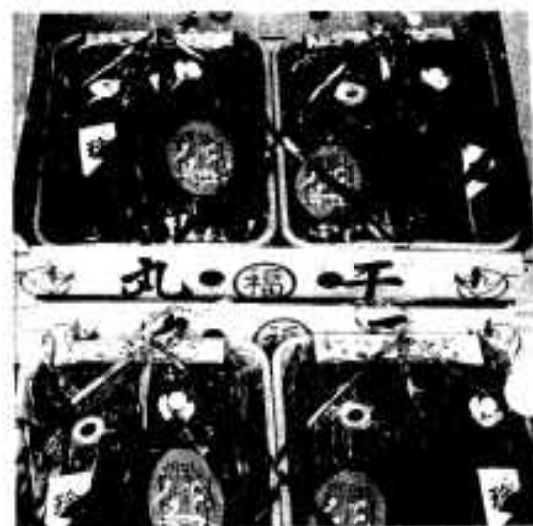
大阪・東京の中央市場をはじめ、中国地方の間屋に阿久根のかがりが運ばれる。

「ガラツ」(語源はポルトガル語)は鹿児島県では、300年前にすでに製品化されていたことが、歴史に残っています。市内大川でも50年前すでにつくられています。このガラツはいまでもありますが、新しい形でできたのが、いまの「丸干し(いわし・あじ・かますなど)」です。この丸干しは昭和36年に製造をはじめ、現在市内に約50台の乾燥機が導入されています。この丸干しの特徴としては、塩かげんがよく、四季を通じて、もっともよい時期のものを加工しているため味もよく、全国的には生産量は少ないが、東京・大阪の中央市場では、日本一の折り紙がつけられています。