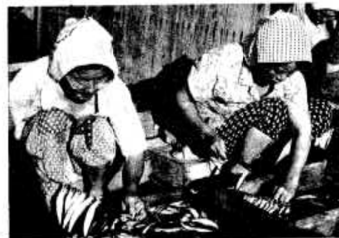
続いて風通しのよい程度に、かんかくをとり、手ざわよく串刺。