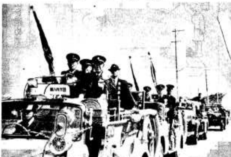
表彰旗を先頭に市中パレード

市消防団が三月四日、東京都の 日本消防会館ホールで、消防長官 から表彰旗が贈られ、六日市中パ レードしたあと、市民会館ホール で祝賀式が行なわれました。