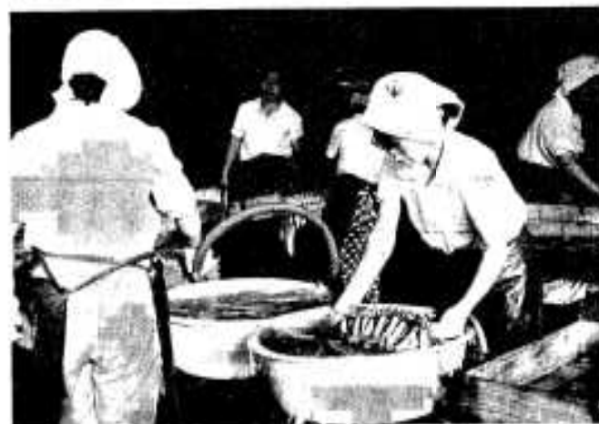
真水で表面の塩を洗い落す。