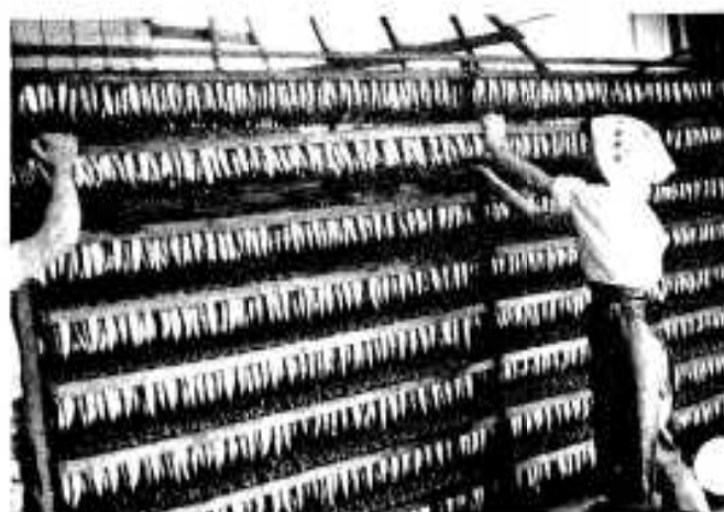
高さ2メートルの台車に8段から10段を乾燥機の中に入れ乾燥風を送り、わか干し約6時間、固干し2昼夜で製品になる。