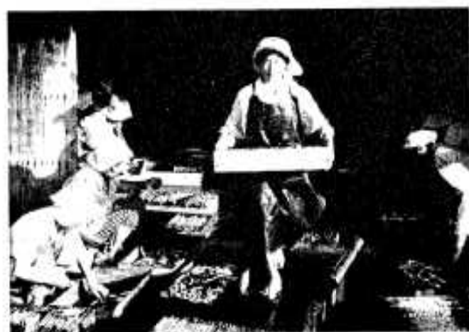
まず、腐敗防止、鮮度保持、味を付けるため塩漬けする。

「ガラツ」(語源はポルトガル語)は鹿児島県では、300年前にすでに製品化されていたことが、歴史に残っています。市内大川でも50年前すでにつくられています。このガラツはいまでもありますが、新しい形でできたのが、いまの「丸干し(いわし・あじ・かますなど)」です。この丸干しは昭和36年に製造をはじめ、現在市内に約50台の乾燥機が導入されています。この丸干しの特徴としては、塩かげんがよく、四季を通じて、もっともよい時期のものを加工しているため味もよく、全国的には生産量は少ないが、東京・大阪の中央市場では、日本一の折り紙がつけられています。