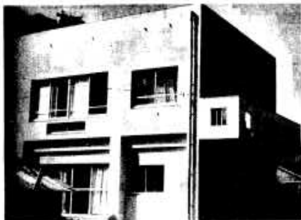
▲完成した「漁村の家」

漁村の家の完成で後継者や婦人部活動が盛り上がり、漁村振興の一歩をになうものと期待されています。