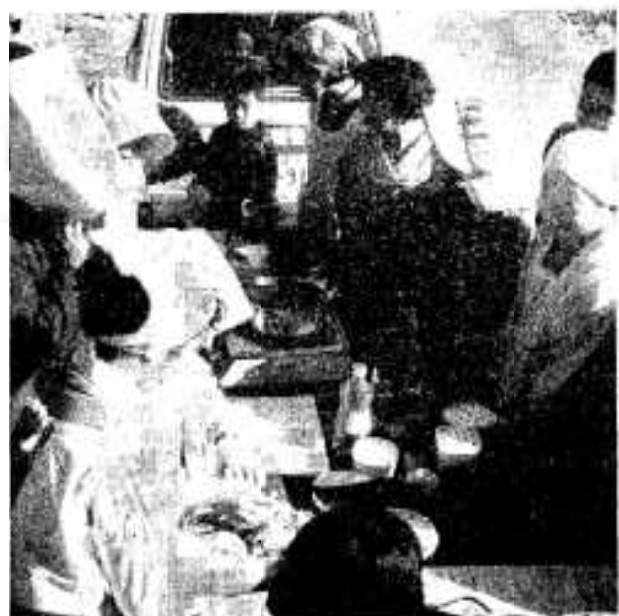
青空のもといよいよ料理の講習が始まる。