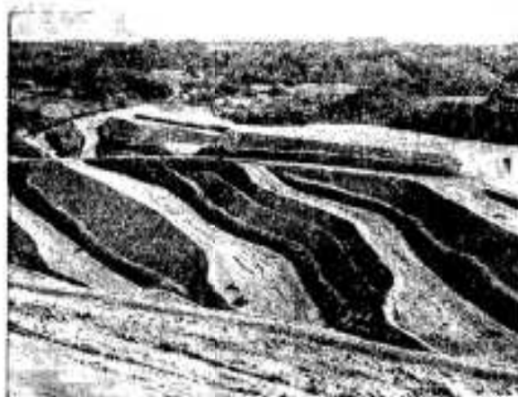
雑木林を切りくずして造成された建て売り農地