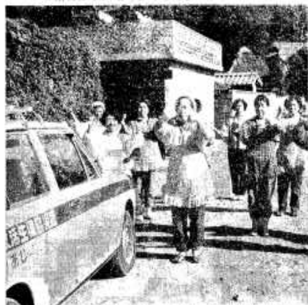
集まった主婦たちは、まず健康と農民体操から。