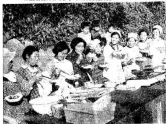
最後は楽しい試食会、みんなの笑声が、明るい青空にこだまする。