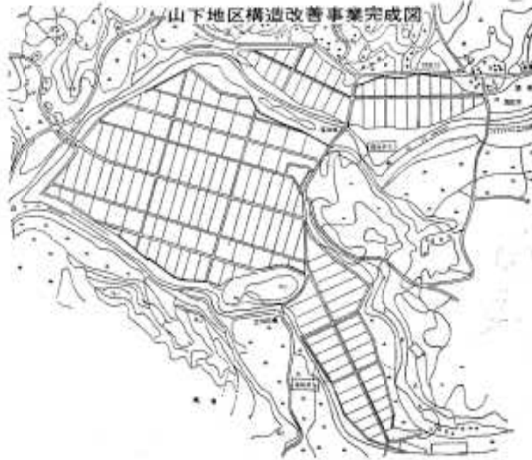
山下地区構造改善事業完成図

この事業は、二カ年間の継続事業ですが、来年度は脇本地区の水場整備を行ない、波留、山下原本の三カ所に各九千三百平方メートルの野菜育苗施設、脇本、山下地区に各五百四十平方メートルの野菜集荷所が建設される予定になっています。