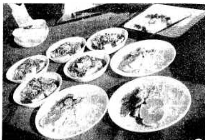
きょうの料理は「ソーセージの磯あげ」と「豆阿の五目あんかけ」、この間約30分。

いつでも、気軽にハンドルを握る、西、京田の両普及員は、北平、大野、倉津の協力員とともに、きょうもまたあなたがたの待つ農漁村地区へ走る。