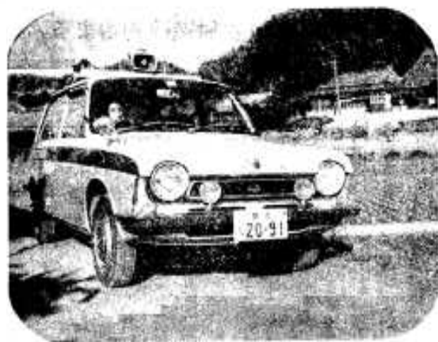
ハンドルさばきも軽やかに「みなさんご苦労さま」と呼びかけ。