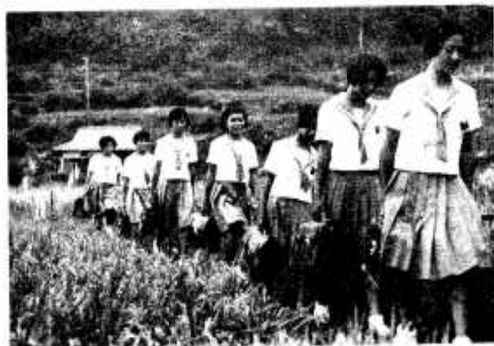
竹刀片手に、田んぼ道をいそぐ彼女らはやはり可愛い中学生にかわりはない。