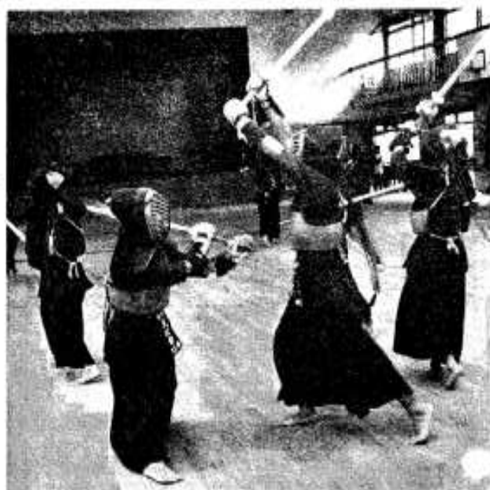
防具をつけてのはげしいけいこ中の彼女らからはとうていセーラ服の少女を想像することはできない。