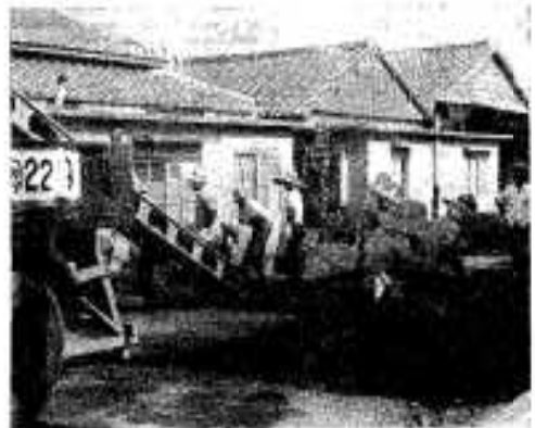
(道路舗装も計画的に進められています)