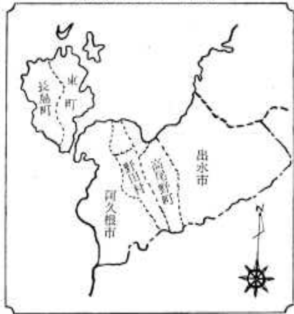
出水地区広域市町村圏

し尿処理事業すでに発足 現在、広域的に処理した方がいいと思われる市町村の仕事はいろいろありますが、北薩広域行政圏で考えられるものは、たとえば、現在進行中であるし尿処理施設をはじめ、ごみ処理場、養老施設などをはじめとする社会福祉の施設、伝染病診療所と共同管理する衛生の施設などあります。そのほか、道路など交通、通信教育文化の施設についても、考え