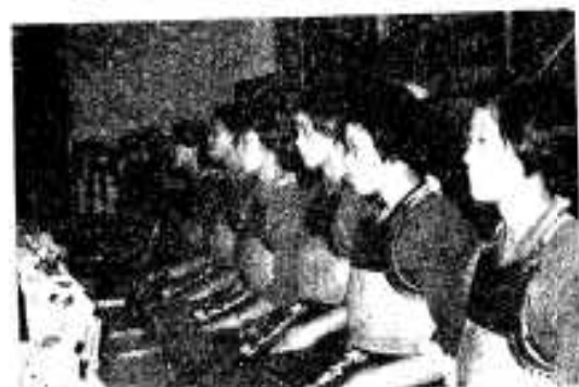
道場に努めろいの彼女らの顔には、すでに少女の笑いを見ることはできない。

1年生4名、2年生10名の彼女らの願いは、一日もはやく日本一の女子剣士となることである。