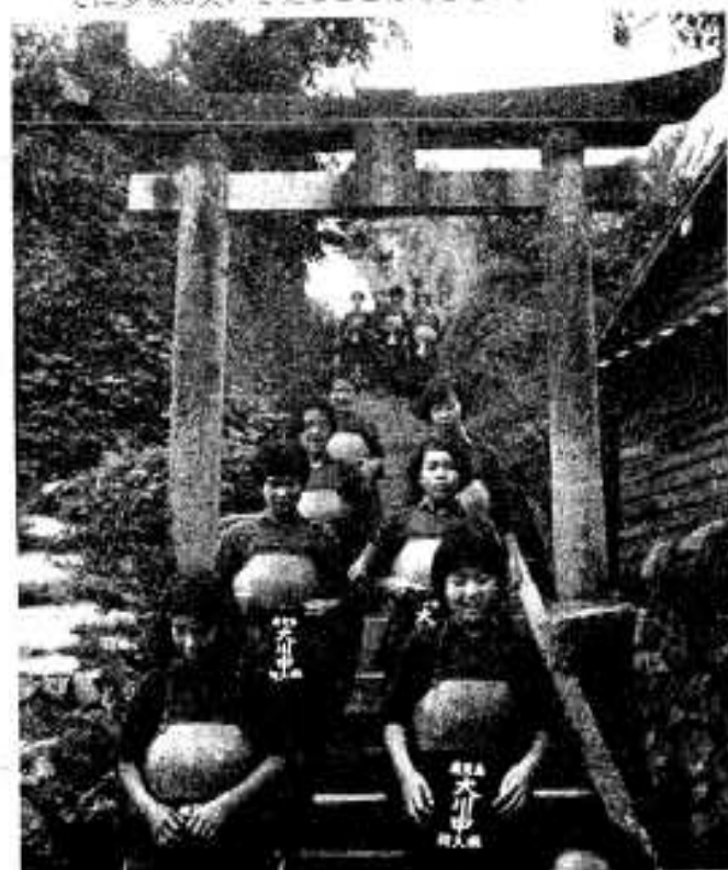
学校近くの霧島神社はかっこうの鍛練の場所である。