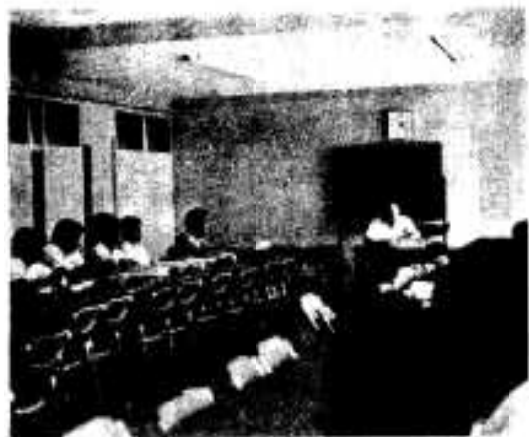
熱者、若い後継者とビジョン対話集會