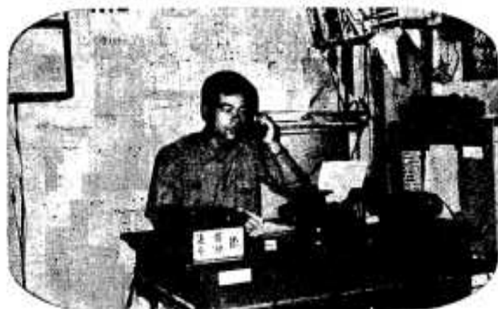
119番のベルがけたたましく鳴り、通信係の隊員の顔が緊張する。