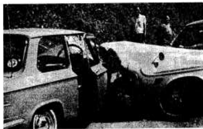
事故現場にはガラスが飛び散り、目をそむける正面衝突