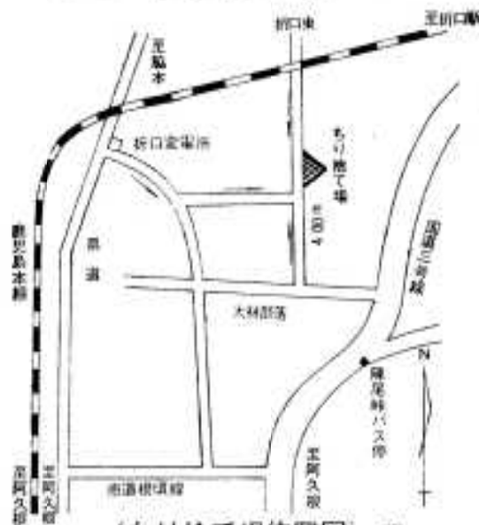
(ちり捨て場位置図)

新しく、チリを捨てるところが折口大橋字長間に設けられました。ここには、危険物のみを捨てることになっていきます。そのほか、残飯は絶対に捨てないようになっています。カヤハエ