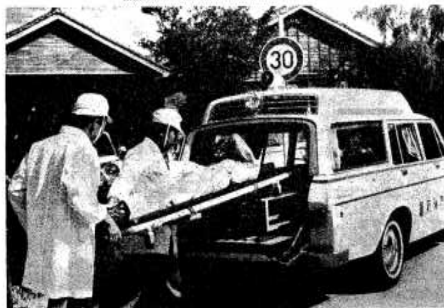
てきばきと重傷者を収容して医療機関へ