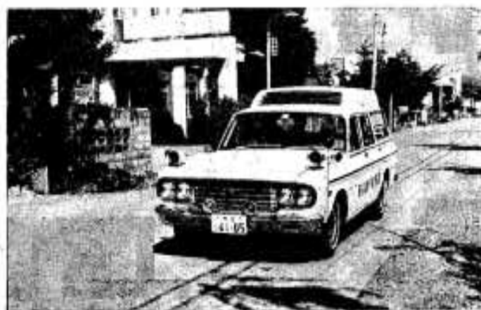
赤いランプが回り、サイレンを無気味に鳴らして事故現場へ直行