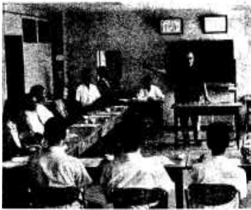
市長宗丹をするあいつを