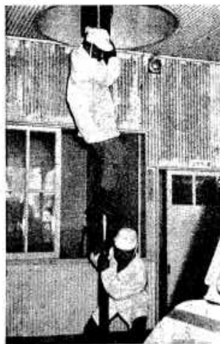
間髪を入れず出動の指令、白衣の隊員はすべり梯を一気にすべり下りる。