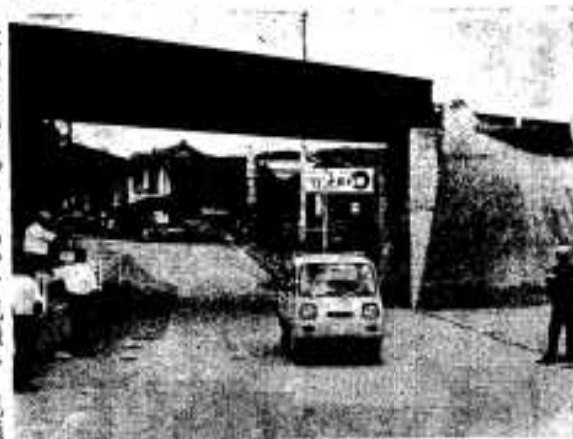
(ハルガード付近を診断する診断員)

市交通安全市民会議ではこのほど、市内全域の道路を診断しました。これは激増する交通事故の防