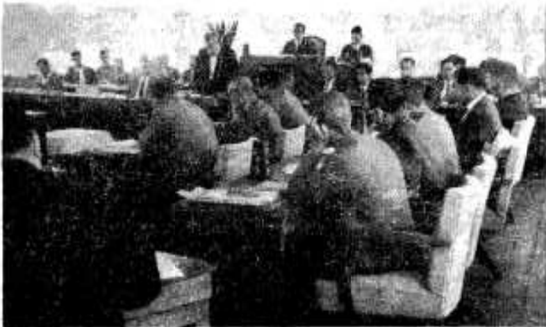
(議案審議中の議会)

●農林水産業費 農業関係では、古里の地 段開墾パイロット事業補助 馬見塚果樹そさい集荷所設 置、農業後継者、資金利 子補給、生活改善資金利子