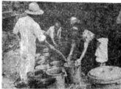
(大角部落にのみ水を給水)

阿久根市では昭和四十 一年十一月、献血推進協議会 を結成し、市民のみならず に献血を呼びかけてきまし たが、現在までに四回の献 血を行ない、三〇六名のか