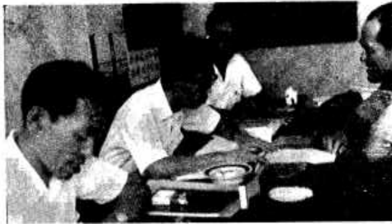
(市民相談室での相談風景)

市民相談室が、市役所表玄関の左側にあらしく設けられました。この相談室が設けられたのはことしの八月一日づけの機構改革により設けられたものであります。市民相談室は農地問題や