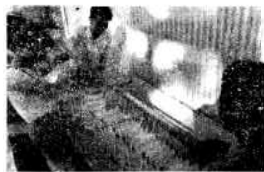
ワカメの胞子づくり

でしよう。大島のキャンプもはじまりました。これから阿久根市をおとす限内外からのキャンプ客も多くな