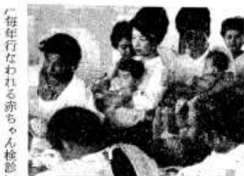
毎年行なわれる赤ちゃん検診