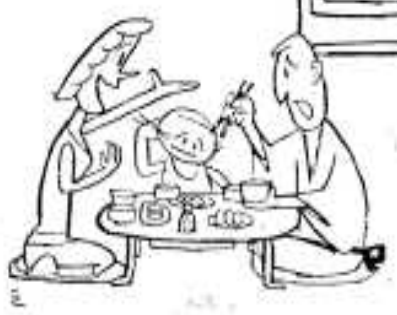
(食中毒予防運動) 厚生省