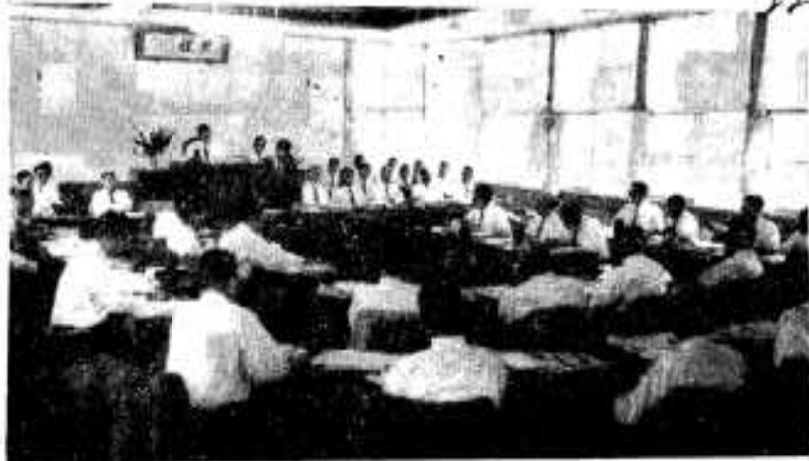
（委員長報告を審議中の本会議）

を予算化し、その準備を進めています。 ●林業関係では、横が倉林道の延長工事請負工事費と有馬島撤除の補助金、 ●水産関係では、宇治川高開発促進協議会・漁業後継者育成対策協議会などの負担金。 ●補助金では、大川島に水