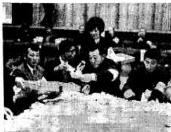
(市民会館での衆議院議員選挙開票風景)